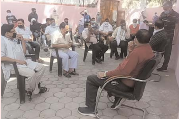
सभी थोक व्यापारी अपने-अपने वाहनों से डोर टू डोर जाकर खाद्य सामग्री जिसमें