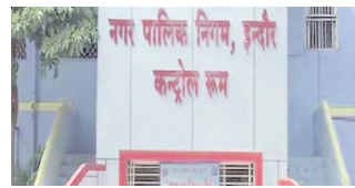
इंदौर। इंदौर नगर निगम के कर्मचारियों ने फिर शर्मनाक हरकत की। इस बार टीम ने एक युवती और गाड़ी को दुकान में सील कर दिया। दोनों करीब 4 घंटे तक बंधक रहे। नगर निगम की टीम कचरा शुल्क वसूलने गयी। नगर निगम को इस हरकत से वाप्यारी पुरसे में है।

रहेड़ी वाले का सामन फेंका था इंदौर में अभी एक हफ्ते पहले नगर निगम के कर्मचारियों ने राजवाड़ा के फूटपाथ पर एक रहेड़ीवाले का सामन फेंक दिया था और उसके साथ मारपीट की थी। उसके बाद एक फिर नगर निगम का अमानवीय चेहरा सामने आया है। शहर के एमजी रोड के अल्फा मारकेट को महज कुछ मीटरों का कचरा शुल्क नग न करने पर सील कर दिया गया। मारकेट का एक सुरक्षा गार्ड और एक युवती भी अंदर ही बंद रह गए। 4 घंटे बंद रही युवती व्यापारियों ने आगस में बंदो कर निगम को टीम को कचरा शुल्क जमा कराया, तब जाकर चार घंटे बाद उस युवती को मुक्त किया गया। शहरवाड़ युवती ने बताया कि वो एक कैमरा शॉप में काम करती हैं और पूरे मारकेट में उनके अलावा कोई नहीं था।