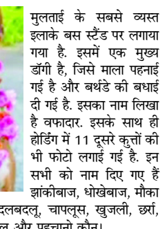
परस्त, दलबदलू, चापलूस, खुजली, छर्ल, फेंकोलाल और पहचानो कौन।

बैतूल। मध्य प्रदेश के बैतूल जिले में लगा एक होर्डिंग वायरल हो गया है। ये होर्डिंग एक डॉगी के बर्थडे पर जिले के मुलताई में लगाया गया है। उसमें बर्थडे वाले डॉगी के अलावा भी कई डॉगी शामिल किए गए हैं। इन्हें जो नाम दिए गए हैं, उसकी वजह से न केवल लोग इसे पसंद कर रहे हैं, बल्कि चर्चा भी कर रहे हैं।