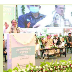
अपना स्थापना दिवस मनाये।

भोपाल। मुख्यमंत्री शिवराज सिंह चौहान ने कहा है कि स्वच्छता के क्षेत्र में मध्यप्रदेश को देश का नंबर वन प्रदेश बनाया जाये। यह तभी संभव है जब हर शहर स्वच्छता के क्षेत्र में सक्रिय हिस्सेदारी निभाये और अपने-अपने शहरों को सबसे सुंदर और स्वच्छ शहर बनाये। मुख्यमंत्री ने नागरिकों को स्वच्छता के लिए प्रदेश को देश का नंबर वन प्रदेश बनाने का संकल्प दिलवाया। मुख्यमंत्री श्री चौहान ने कहा कि हर शहर को अपनी विरासत पर गर्व होना चाहिए। इस विरासत को आगे बढ़ाने तथा विकास में जन-भागीदारी सुनिश्चित करने के लिये सभी शहर अपना