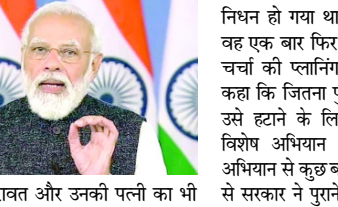
जनरल बिपिन रावत और उनकी पत्नी का भी

मोदी ने देशवासियों से कहा कि वे ओमिक्रॉन वैरिएंट को हल्के में न लें और कोरोना संबंधी सभी नियमों का पालन करें। पीएम मोदी ने अपने संबोधन में ग्रुप कैप्टन वरुण सिंह की उस चिट्ठी का भी जिक्र किया जिसमें उन्होंने औसत से असाधारण बनने का मंत्र दिया था। बता दें कि वरुण सिंह उसी हेलीकॉप्टर हाइसे में मारे गए थे जिसमें देश के पहले सीडीएस