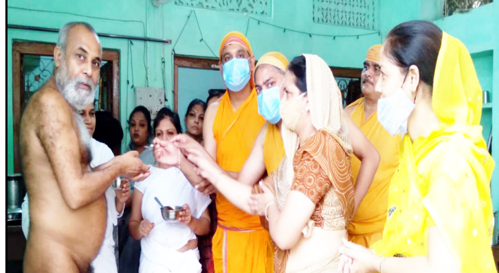
समाजजनों ने पदाप्रक्षालन कर धर्मसभा का शुभारंभ किया