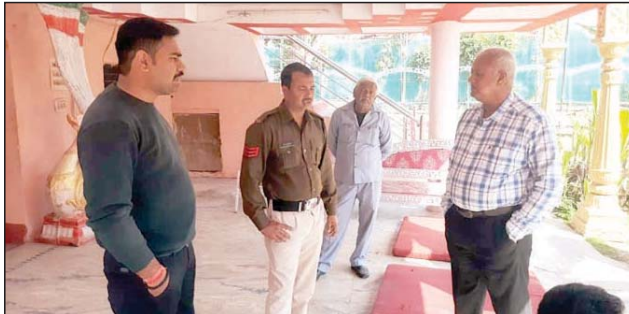
मंगल वारिका में फलदान समारोह से ढाई लाख लेकर उड़े चोर, शहर में नहीं जिम्मेदार है अधिकारी, चोर लुटेरे सक्रिय

मुरैना। शहरियों में मेला खलकर, चटनी, दही बड़े फैलाकर रूपयों से भरै थैले बेग छीनेने एवं गायब करने की घटनाएं आए दिन सामने आ रही हैं। शहर में मिठाई सक्रिय हो चुका है और लगातार वारदात कर रहा है। बीती रात चोर मिठाई जीवाजी गंज स्थित गंगू सेवा सदन में आयोजित फलदान समारोह से 8 लाख एवं मंगल वारिका में आयोजित फलदान समारोह से ढाई लाख रूपय लेकर रफूचक कर आ गए। गंगू सेवा सदन में