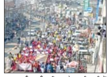
चरखी दादरी। हरियाणा के चरखी दादरी में एक बार फिर से किसानों ने खापों की अगुआई में सड़कों पर उतर कर केंद्र सरकार के खिलाफ मोर्चा खोल दिया। किसानों ने विधायक दिवस मनाते हुए केंद्र सरकार का पुल्ला दहन किया।

राष्ट्रपति के नाम ज्ञापन सौंपा। चेतावनी भी दी कि अगर किसानों की मांगें पूरी नहीं होती हैं, तो दिल्ली बॉर्डर को फिर से सील करने में देरी नहीं होगी। प्रदेशभर की खाप पंचायतें किसानों के साथ मिलकर दबावा से आंदोलन के लिए तैयार हैं। रोजगार से शुरू हुआ रोष प्रदर्शन: फौजदारी खाप की अगुआई में जिलेभर की खापों, सामाजिक और सरकारी संगठनों ने सरकार के खिलाफ प्रदर्शन किया। इस दौरान किसान रोजगार में इकट्ठा हुए और सरकार की कथित वादावलीपत्री पर भरोसा किया। ये खापें किसानों के साथ उतरें: करीब दो घंटे मीथन के बाद किसानों ने रोजगार में लगे लघु संचालक तक रोष प्रदर्शन करते हुए