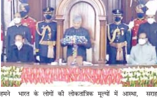
भारत के लोगों की लोकतांत्रिक मूल्यों में आस्था, सराफनीय उदाहरण है। इससे न केवल वतनीय की

बेटों को समानता का दर्जा देते हुए मेरी सरकार ने महिलाओं के विवाह के लिए न्यूनतम आयु को 18 वर्ष से बढ़ाकर पुरुषों के समान 21 वर्ष करने का विधेयक भी संसद में प्रस्तुत किया है। उन्होंने कहा कि मैं देश के उन लाखों स्थायीता सेनापियों को नमन करता हूँ, जिन्होंने अपने कर्तव्यों को सर्वोच्च प्राथमिकता दी और भारत को उसके अधिकार प्रदान किए। आजादी के इन 75 वर्षों में देश की विकास यात्रा में आपन योगदान देने वाले सभी महानुभावों का भी मैं अग्र-पूर्वक स्मरण करता हूँ। राष्ट्रपति ने कहा कि कोरोना संकट से उत्पन्न वैश्विक महामारी का ये तीसरा वर्ष है, इस दौरान हमने