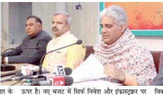
ऊपर है। नए बजट में विभिन्न क्षेत्रों और इन्फ्रास्ट्रक्चर पर विकास सभी सचिव है जब सड़कों का जाल तेजी से