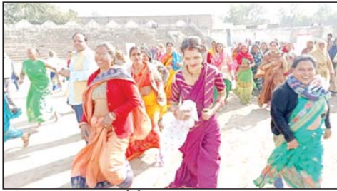
आनंद उत्सव संपन्न, परंपरागत खेलों का हुआ आयोजन

मुरैना। डॉ भार्गव अवेडकर स्टैडियम में आनंद उत्सव 2022 के तहत परंपरागत खेलों का आयोजन किया गया। इस आयोजन में नारीय क्षेत्र के युवा व बुढ़जनों ने अपने हुनर व खेलों का प्रदर्शन करते हुए सभी का दिल जीत लिया। खेलों में 25 वर्ष से 60 वर्ष तक के प्रतिभागियों ने अपने कोशल खेलों का प्रदर्शन करते हुए किसी ने लम्हा दौड़ तो किसी ने भाला फेंककर अपने हुनर का प्रदर्शन किया। आनंद उत्सव में बुढ़जनों द्वारा भी काफी जोश और उत्साह