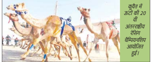
कुवैत में ऊठों की 20 वीं अंतरराष्ट्रीय रैसिंग वीम्यनशप आयोजित हुई।

के सभी सदस्यों को इनाम के तौर पर 1-1 लाख रुपये दिए गए। इस कन्सर्ट में लता मंगेशकर ने कई गाने गाए और दर्शकों को अपनी आवाज और अंदाज से भावविभोर कर दिया। उनके 'भारत विश्व विजेता' गाने को खूब सराहा गया जिसका संगीत इंदरनाथ मंगेशकर ने दिया था। जब लता दीदी मंच पर यह गाना गा रही थीं, तब भारतीय क्रिकेट टीम के खिलाड़ी उनके सुर में सुर मिला रहे थे। लता ने इस कन्सर्ट के लिए बीसीसीआई से कोई भीस नहीं ली थी। वही बीसीसीआई और तत्कालीन खिलाड़ियों ने लता मंगेशकर के इस योगदान को हमेशा याद रखा।