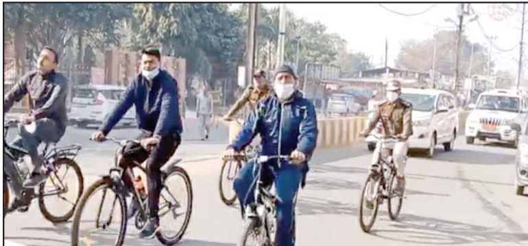
लगातार जिले के थानों का निरीक्षण कर व्यापारियों में पुलिस के प्रति विश्वास बनाने में जुटे

मुरैना। शहर एवं जिले में अमन शांति कायम रखे तथा अपराधियों में खौफ पैदा हो, इसके लिए पुलिस