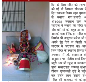
दैनिक पुष्पांजली टुडे शिवमंदिर पर 12 किलोमीटर दूर स्थित ग्राम नीमगांव में शिव मंदिर का स्थापना दिवस मनाया गया मंदिर के पुजारी ने दिल्ली जाकार की अनुसार ग्राम नीमगांव में आज के