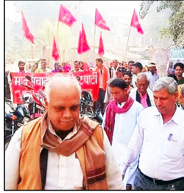
जीत है। मध्य प्रदेश किसान सभा ने इस जीत के लिए किसानों को बधाई दी है।

साथ मुख्यमंत्री शिवराज सिंह चौहान से ऑनलाइन वार्ता की। जिसमें मुख्यमंत्री द्वारा जिन किसानों की जमीन अधिग्रहित हो रही है, उन्हें जमीन के बदले दुगुनी जमीन देने की पुरानी नीति दोहराई। साथ ही यह भी घोषणा की कि जो किसान जमीन के बदले दुगुनी जमीन नहीं लेना चाहते हैं। उन्हें बाजार मूल्य से दुगुनी दर से मुआवजा दिया जाएगा। यह किसान आंदोलन की