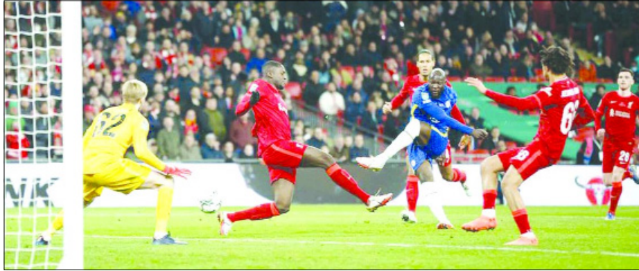
चेलेसा और लीवरपूल मुकाबले में रोमिजू लूकाकु गोल दागते हुए।