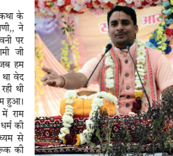
लक्ष्मण से सम्मानित जीवन को श्री राम के जीवन को देखकर आम जनमानस सोच लेनी चाहिए। आज की कथा में सर्व प्रथम गुरु वंदना और राम नाम की महिमा भक्त गणों को सुनाई गई कल बुवार को भाववत शिव