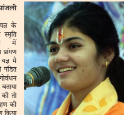
भाववत की रास क्रीड़ा एवं भाववत और रुक्मिणी जी के विवाह की कथा का श्रवण