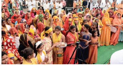
और सती के चरित्र का वर्णन किया जाएगा कथा के प्रथम दिन मिंड मूरना के तमाम ग्रामीणों के ग्रामीण ट्रैक्टरों में बैठ।