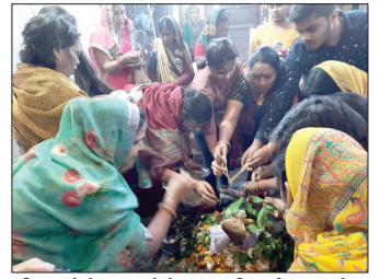
शिवलयों में श्रद्धालुओं ने भगवान शिव की पूजा-अर्चना -जिले भर में महाशिवरात्रि पर्व मंदिरों पर उमड़ी भीड़