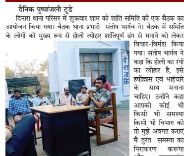
पुलिस आपके लिए हमेशा तय है आप मुझे नंबर पर किसी भी समय फोन लगा सकते हैं किसी भी अग्रिय घटना घटित एक्सिडेंट के लिए। पुलिस पब्लिक से समन्वय स्थापित करे ताकि लोग पुलिस पर भरोसा कर सकें। मौके पुलिस स्टॉप पत्रकार गण जनप्रतिनिधि आदि मौजूद रहे।