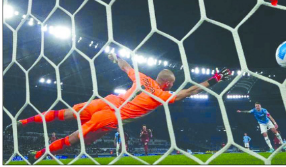
रोम में सीरीज एक फुटबॉल में पेनाल्टी किक लगाते हुए लेजियो के सिरों इमोबाइल।

मुम्बई । 26 मार्च से शुरू हो रहे इंडियन प्रीमियर लीग (आईपीएल) के 15 वें सत्र में कुछ बड़े बदलाव देखने को मिलेंगे। इसके तहत अगर कोरोना संक्रमण के कारण किसी टीम के पास अंतिम ग्यारह नहीं होती है तो भारतीय क्रिकेट बोर्ड (बीसीसीआई) उस मैच को दोबारा आयोजित करेगा। वहीं अगर मैच का दोबारा आयोजन संभव नहीं होता है तो इस मामले को तकनीकी समिति के पास भेजा जाएगा। बीसीसीआई ने कहा, 'बोर्ड अपने विवेक के आधार पर बाद में मैच को पुनर्निर्धारित करने का प्रयास करेगा पर अगर ऐसा नहीं हो पाता है तो इस मुद्दे को आईपीएल तकनीकी समिति के पास भेजा जाएगा। आईपीएल तकनीकी समिति का निर्णय अंतिम, जिसे सभी को मानना होगा। यह पिछले नियम की तरह ही है, इसमें केवल एक बदलाव किया गया है। पिछले नियम में कहा गया था कि बोर्ड बाद में मैच को पुनर्निर्धारित करने का प्रयास करेगा। अगर यह संभव नहीं है तो प्रभावित फ्रेंचाइजी को हारा हुआ माना जाएगा और उसके प्रतिद्वंद्वी को दो अंक दे दिए जाएंगे। वहीं एक अन्य बदलाव डीआरएस (डिडीसीन रिच्यू सिस्टम) को लेकर हैं। बोर्ड के अनुसार बीसीसीआई के मुताबिक प्रत्येक पारी में डीआरएस की संख्या एक से बढ़ाकर दो कर दी गई है। बीसीसीआई ने मैरीलेबोन क्रिकेट क्लब (एमसीसी) के सुझाव के बाद यह निर्णय लिया है, जिसमें कहा गया था कि नए बल्लेबाज को स्ट्राइक पर आना होगा, भले ही बल्लेबाज कैच के दौरान क्रीज के बीच में क्यों न हो बशर्ते वह ओवर की अंतिम गेंद न हो।