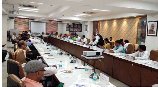
क्षेत्रों में बहुत सारी आवश्यकता है रेल का विकास व्यापक रूप से विकास होना चाहिए रायपुर रेल मंडल में महासमुंद रेल स्टेशन को जोड़ने की मांग एवं प्रदेश में नई रेल लाइन विद्युत के मांग और यात्रियों की सुविधा उपलब्ध कराने के लिए प्रदेश में बहुत सारी क्षेत्र में रेल लाइन की सर्वे की काम है वहीं अन्य प्रदेश मध्य प्रदेश में बालाघाट जिले से रेल लाइन के जोड़ने की जो अर्धुर कामों से पूर्ण किए जाए। किसी भी गांव व क्षेत्र का विकास

आवगमन सुविधा के बिना असंभव है, सड़क मार्ग रेल मार्ग आदि आवगमन के मुख्य साधन में शामिल है। वस्तर को प्रदेश की राजधानी रायपुर से जोड़ने के लिए वर्तमान में एकमात्र सड़क राश्ट्रीय राजमार्ग क्रमांक 30 से होकर आवगमन की सुविधा है। सड़क मार्ग होने के चलते कभी सड़क मरम्मत तो कारण आता दिन किसी न किसी कारणों से आवगमन बाधित होने के मामले आते रहते हैं। केंसल कराने की मांग स्थानीय ग्रामाणों जनप्रतिनिधि वित्त नगरिकों के द्वारा बार-बार अवगत कराया गया आज तक मांग पूरी नहीं हुई वहीं रायपुर से रायम गुरियावद देवभोग को रेलवे रेल मार्ग से जोड़ने की मांग सर्वे