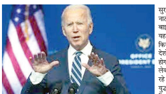
नई दिल्ली। रूस और यूक्रेन के बीच चल रहे युद्ध को करीब पांच सप्ताह से अधिक का समय हो चुका है। दोनों देश पीछे हटने को राजी नहीं हैं। दोनों देशों के युद्ध के बीच अमेरिकी राष्ट्रपति जो बाइडन ने रूस को खबरदार किया है। उन्होंने कहा है कि रूस नाटो की सीमा में एक इंच घुसे तो नहीं संचे वरना इसके परिणाम अच्छे नहीं होंगे। युद्ध या तैयारी विषय युद्ध का नाम लिए बरबर बाइडन ने पुतिन को ललकारा है। यह पहली बार है जब बाइडन ने रूस के खिलाफ सख्त चेतावनी दी है। खास बात यह है कि नाटो संघटन की बैठक के बाद बाइडन का यह बयान सामने आया है। यूक्रेन संघर्ष के दौरान यह रूस के लिए एक गैरवादात्मक है। बाइडन ने साफ कर दिया है कि रूसी सेना को यूक्रेन तक ही सीमित रहना होगा। इस दौरान उन्होंने कहा कि नाटो एकजुट है। उसे तोड़ना नहीं जा सकता है। आखिर बाइडन के तैयार अचानक कहीं सख्त हुए इसके पीछे बड़ी वजह क्या है क्या रूसी राष्ट्रपति पुतिन पर बाइडन के इस चेतावनी का असर होगा

सूत्रों को लेकर चिंतित है। चूंकि अमेरिका नाटो संघटन का एक प्रमुख देश है। ऐसे में बाइडन का यह बयान लाजमी है। उन्होंने यह बयान देकर जहां पुतिन को सावधान किया है वहीं इसका असर नाटो के सदस्य देशों के लिए भी विषयवस्तु दिखाने वाला होगा। उन्होंने कहा कि पुतिन यूक्रेन को लेकर आशंका को लड़ाई के मुद्द में दिख रहे हैं। इसलिए पुतिन का चुकें है कि इस युद्ध में जो शामिल होगा उसको रूसी मिसाइलों का सामना करना होगा। उनका