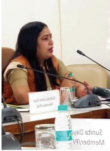
ध्यानकार्य कराते हुए छत्तीसगढ़ में क्षेत्रों में रेल लाइन विद्युत के लिए और यात्रियों की सुविधा के लिए उनके समाधान के लिए मांग की गई छत्तीसगढ़ के कई क्षेत्र हैं जहां पर भी रेल मांग की सुविधा नहीं है और इस वनांचल आदिवासी

रायपुर — भारतीय रेल बोर्ड रेल मंत्रालय भारत सरकार के द्वारा पी ए सी बोर्ड की बैठक दिनांक 24 /03/ 2022 को नई दिल्ली रेल भवन में आयोजित की गई इस बैठक में रेल बोर्ड के चेयरमैन श्री पी के कृष्णदास। जी एवं सभी सदस्यों की उपस्थिति में आयोजित की गई। सभी रेलवे स्टेशन ट्रेन में सफर कर यात्रियों के लिए कई सुविधाओं के ऊपर विस्तृत चर्चा की गई साथ ही उनके समाधान के विषय पर एक ही करके विचार-विमर्श करके संबंधित अधिकारियों को अवगत कराकर उनके समाधान का पूरा प्रयास किया गया इस अवसर पर रेल बोर्ड पी ए सी सदस्य विभा अवस्थी के द्वारा छत्तीसगढ़ के विभिन्न मुद्दों पर बात की गई साथ ही छत्तीसगढ़ से लगे अन्य क्षेत्रों पर उन्हें ध्यानकार्य करा कर उक्त मांगों के समाधान के लिए मांग श्री पी के कृष्णदास चेयरमैन पी ए सी बोर्ड के माध्यम से केंद्रीय रेल मंत्री भारत सरकार श्री अशोक कुमार वैद्यवाणी जी से समाधान करने के लिए आग्रह किया। पूनः एक बार छत्तीसगढ़ पर केंद्रीय मंत्री और समिति के चेयरमैन का