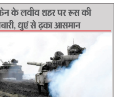
यूक्रेन के लवीव शहर पर रूस की बमबारी, घुए से दृक आसमान

सूत्रों को लेकर चिंतित है। चूंकि अमेरिका नाटो संघटन का एक प्रमुख देश है। ऐसे में बाइडन का यह बयान लाजमी है। उन्होंने यह बयान देकर जहां पुतिन को सावधान किया है वहीं इसका असर नाटो के सदस्य देशों के लिए भी विषयवस्तु दिखाने वाला होगा। उन्होंने कहा कि पुतिन यूक्रेन को लेकर आशंका को लड़ाई के मुद्द में दिख रहे हैं। इसलिए पुतिन का चुकें है कि इस युद्ध में जो शामिल होगा उसको रूसी मिसाइलों का सामना करना होगा। उनका