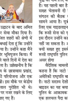
चंडीगढ़। केन्द्रीय गृहमंत्री अमित शाह ने चंडीगढ़ पहुंचकर विभिन्न विकास परियोजनाओं का उद्घाटन किया है। इस दौरान पंजाब के राज्यपाल और चंडीगढ़ के प्रशासक बनवारीलाल पुरोहित भी मौजूद रहे। विकास परियोजनाओं के उद्घाटन के बाद अमित शाह ने कहा कि, नगर निगम को फिर सेना मकान दिया है। उन्होंने कहा कि चंडीगढ़ विश्व इतिहास में नियोजित शहरों की श्रेणी में सबसे विकसित शहर है। मैं चंडीगढ़ प्रशासन को बधाई देता हूँ कि उन्होंने चंडीगढ़ में बदलाव के कथ चलेना का क्रम बनाया है। उन्होंने कहा मैंने आज कई विकास परियोजनाओं का लोकार्पण और प्रारंभ किया है। मैं आज यह जकर बताना चाहता हूँ कि चंडीगढ़ और वाले दिना में देश का सबसे विकसित और आधुनिक शहर बनने वाला है। उल्लेखनीय है कि अमित शाह ने रिवरफोर्ज क्वार्टिंग्स मालिखालय के उद्घाटन प्रबंध, पुलिस कर्मियों के लिए 240 आवास निर्माण को परियोजना और एक सड़क-रह-कार्यवाही को भी उद्घाटनारंभ किया है। इस मौके पर केन्द्रीय मंत्री के साथ पंजाब के राज्यपाल बनवारीलाल पुरोहित भी थे। आईसीसीपी परियोजना के तहत यातायात उन्नत पर नजर रखने के लिए शहर में 2,000 से अधिक सीसीटीवी कैमरे लगाए गए हैं।