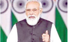
जिसका साफ मतलब ये है कि भारत में बने सामानों का डिमांड बढ़ रहा है संवोधन के दौरान पीएम ने बाबा शिवानंद का जिक्र किया। उन्होंने कहा कि श्रद्धा ही में संपन्न हुए पप पुरस्कारों में आपने बाबा शिवानंद को देखा है

प्रधानमंत्री कार्यालय तथा सूचना और प्रसारण मंत्रालय के यू-ट्यूब चैनल पर किया जाएगा। पीएम ने अपने कार्यक्रम में कहा कि हमारा देश ने 30 लाख करोड़ का निर्यात किया है जो कि ऐतिहासिक है। उन्होंने कहा कि भारत ने 400 अरब डॉलर के निर्यात का हलकालिक कर लिया है। यह भारत की क्षमताओं को संज्ञात है। इसका मतलब है कि दुनिया में भारतीय सामानों की मांग बढ़ रही है। पीएम मोदी ने कहा कि एक समय में भारत से एक्सपोर्ट का आंकड़ा कभी 100 बिलियन, कभी डेढ़ सौ बिलियन तक हुआ करता था, आज भारत 400 बिलियन डॉलर तक पहुंच गया है।