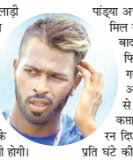
हार्दिक पण्ड्या आईपीएल में अच्छे प्रदर्शन के आधार पर कई खिलाड़ी आगामी टी20 विश्व कप क्रिकेट मुकाबले के लिए अपनी दावेदारी पेश कर सकते हैं।

मुंबई। पूर्व भारतीय क्रिकेटर और महान खिलाड़ी सुनील गावस्कर के अनुसार इंडियन प्रीमियर लीग (आईपीएल) में अच्छे प्रदर्शन के आधार पर कई खिलाड़ी आगामी टी20 विश्व कप क्रिकेट मुकाबले के लिए अपनी दावेदारी पेश कर सकते हैं।