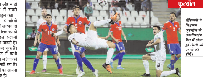
फुटबॉल संदेशियों में पिछले एक हफ्ते के हालातों के कारण टीमों में खतरा है।

पण्ड्या अच्छी गेंदबाजी करते हैं तो उन्हें टीम में जगह मिल सकती है। हार्दिक को पिछले आईपीएल के बाद से ही गेंदबाजी न कर पाए और खराब फिटनेस के कारण टीम में शामिल नहीं किया गया है।