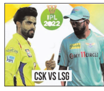
CSK VS LSG नवंबर 2022

नई दिल्ली। चेन्नई सुपर किंग्स ब्रेवोंन स्ट्रेडियम में IPL-15 के अपने दूसरे लीग मैच में आज लखनऊ सुपर जायंट्स से भिड़ेगी।