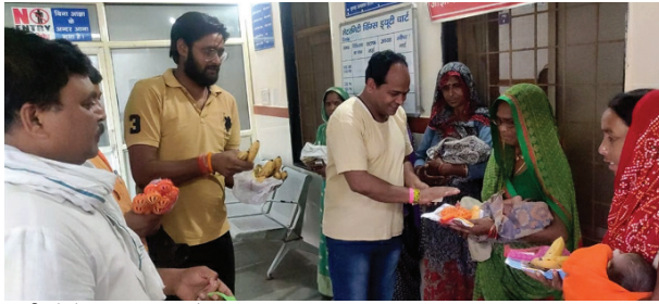
नवमी को होगा नवजात कन्याओं की दादी अम्माओं का सम्मान