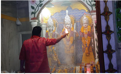
कन्या पूजन के साथ नवदुर्गा का हुआ समापन

मुरैना। 2 अप्रैल से शुरू हुआ नवदुर्गा महोत्सव का समापन रविवार को कन्या पूजन के साथ संपन्न हुआ। रविवार को रामनवमी के अवसर पर अंचल के प्रमुख देवी मंदिरों में भक्तों ने नैजे चढ़ाये वहीं जवारे भी समर्पित किये। इस अवसर पर नगर के प्रमुख मंदिरों पर भी शनिवार को देर रात हवन आदि के उपरान्त रविवार को सुबह कन्या पूजन प्रसादी विधि का किया गया। दुर्गा अष्टमी से ही मां के हजारों भक्तों ने कनक दण्डवत लगाना आरंभ