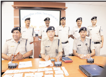
धाना गोला का मंदिर के कुल 8 अपराधों में लगभग 07 लाख रुपये का मशरूका किया गया।