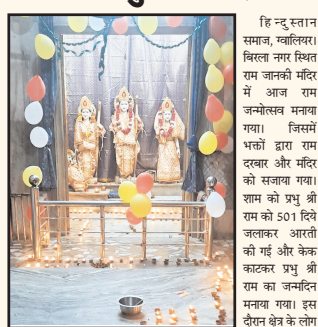
हिन्दू स्नान समान, गवालियर। बिरला नगर स्थित राम जानकी मंदिर में आज राम जन्मोत्सव मनाया गया।