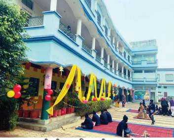
40-50 फीसदी अनुमानित कमिशन का खेल

शहर के नामी निजी विद्यालय से जुड़े सत्रों में बताया कि निजी स्कूल फ्रीस से अधिक कमिशन किताब विक्रेता एवं प्रकाशक से सांठगट कर कमाल हैं। प्रकाशन स्कूल में आकर छात्र संख्या के हिसाब से किताबों का सिलेबस तय करते हैं कमिशन के लिए निजी विद्यालय केंजी से लेकर 8 वीं तक निजी प्रकाशकों की किताबें चलाकर 40 से 50 फीसदी कमिशन काटते हैं।