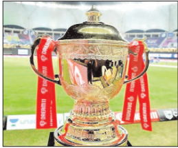
लगातार दो बार से इटका लगा है। ऐसे में जीत को हाह पर लौटने के लिए टीम को बल्लेबाजी और गेंदबाजी दोनों में सुधार करना होगा। आदि रसल को छेड़कर केकेआर का कोई भी बल्लेबाज लगातार रन नहीं बना

पाया है जो टीम के लिए चिन्ता का कारण है। ऐसे में उमरान राजस्थान के खिलाफ जीत दर्ज करनी है तो अन्य खिलाड़ियों को भी बेहतर प्रदर्शन करना होगा। रसल ने केकेआर की ओर से अब तक छह मैचों में सबसे ज्यादा 179 रन बनाए हैं और टीम को उनसे इस मैच में भी इसी प्रकार के खेल की उम्मीद होगी।