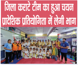
जिला कराटे टीम का हुआ चयन प्रादेशिक प्रतियोगिता में लेगी भाग

जीनियस पब्लिक स्कूल ने सूची में संदीप बुक सेंटर का पता तक नहीं दिखाया है राजू बुक सेंटर व सीएम बुक सेंटर एक ही परिवार के हैं लोगों द्वारा बताया गया है स्व कमिशन का खेल है एक ही बुक सेंटर वाले ने दो दो बुक सेंटर के पंजीयन अलग अलग नाम से करके रखे हुए हैं।