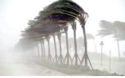
के कई हिस्सों में बोरदोईसिला ने कहर डाला है। राज्य में गर्मियों के मौसम में अंधी का साथ होने वाली बारिश को बोरदोईसिला कहा जाता है। आंधी से कई इलाकों में बिजली के खम्बे उखड़ गए हैं। मनीजेशन कई इलाकों में बिजली की सप्लाई टप हो गई है। एक सरकारी अस्पताल में कहा गया है कि 12 हजार से अधिक घरों को नुकसान पहुंचा है। राज्य के 12 जिलों के करीब तीस सौ गांवों में 20 हजार से ज्यादा लोग इससे प्रभावित हुए हैं। 47 गांवों के 1000 घरों को नुकसान मेघालय के री-बोर्न जिले में भी चक्रवाती तूफान ने तबाही मचा रखी है। इस तूफान ने अलग-अलग 47 गांवों के 1000 से ज्यादा घरों को नुकसान पहुंचाया है। कई लोग बेघर हो

तादायक सैकड़ों में है। भारी बारिश और तूफान ने हजारों घरों को नुकसान पहुंचाया है। भारतीय मौसम विभाग ने अगले पांच दिनों के दौरान अरुणाचल प्रदेश, अस्म, मेघालय, नागालैंड, मणिपुर, मिजोरम और त्रिपुरा में गरज के साथ बारिश या बिजली गिरने की भविष्यवाणी की है। अस्म में शनिवार को भीषण तूफान के साथ आसमानी बिजली गिरने के कारण कम से कम 14 लोगों की मौत हो गई। अस्म राज्य अपना प्रबंधन प्राधिकरण के अनुसार बीते गुरुवार से ही अस्म