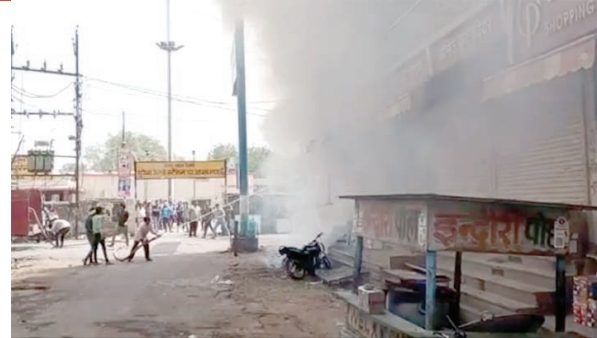
फायर ब्रिगेड को सूचना दी। मुख्यालय से तुरंत दो फायर ब्रिगेड मौके पर पहुंचीं और दमकल कार्रवाई में आधा घंटे की मेहनत के बाद आग पर काबू पा लिया, लेकिन तब तक दुकानों में रखा