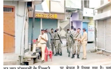
हर बार दंगाइयों के निशाने पर मकान

चार दशकों में चार दौरे झेले हैं। एक दशक में दो बार यहां हालात बिगड़े। इस दौरान थपथप, पेटोल बम का सामना करने वाले 30 से ज्यादा परिवारों की हिमात जवाब दे गई और करीब 30 से ज्यादा मकान बिक गए। इनमें हिन्दू परिवारों के मकान ज्यादा हैं। इस बार रामनवमी पर हुए दंगे के बाद भी दंगा प्रभावित इलाकों के 20 से ज्यादा मकानों के बाहर %मकान बेचना है' लिखा देखा गया। उन परिवारों से विश्व हिन्दू परिषद, बजरंग दल जैसे संगठनों के कार्यकर्ता संपर्क कर फैसला बदलने की कवायद कर रहे हैं, लेकिन दंगों के दौरान मीठ की करीब से गुजरते देख लोग उनसे यह सवाल पूछते हैं कि इस बार तो हमारी जान बच गई है अगली बार दंगे तो फिर कौन हमें बचाए आएगा?