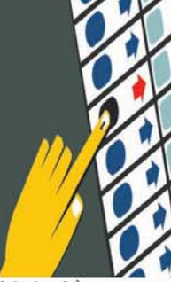
की स्थिति बनी है।

कोरोना संकट के बीच प्रदेश में उपचुनाव की आहट है। 24 विधानसभा सीटों पर जल्द ही उपचुनाव कराए जाने के संकेत चुनाव आयोग ने दिए हैं। इसको लेकर मुख्य निर्वाचन पदाधिकारी कार्यालय ने 15 जिलों के कलेक्टरों को चिट्ठी लिखकर चुनाव आचार संहिता संबंधी नियमों का पालन कर्मचारियों के स्थानांतरण और पदस्थापना के मामले में करने के निर्देश दिए हैं। इन विधानसभा क्षेत्रों में साल से जमे अफसरों को हटाया जाएगा। जिन जिलों में उप चुनाव होना है उसमें सबसे अधिक सुरेन्द्रा जिले की है ये हैं जौरा, सुमावली, सुरेन्द्रा, दिमनी और अंबाह सीटें हैं। जबकि भिंड में मेहगांव, गोहद, ग्वालियर जिले में ग्वालियर, ग्वालियर पूर्व और डबरा, दतिया में भांडेर, शिवपुरी में करैरा और पोहरी, अशोकनगर में अशोकनगर, गुना में गुना, सागर में सुरखी अशोक नगर में बामोरी, अनुपपुर जिले अनुपपुर, रायसेन में सांची, इंदौर में सांवेर, देवास में हाटपीपल्ला, मंदसौर जिले में सुवासरा धार में बदनवार, आगर जिले में आगर विधानसभा सीटें उप चुनाव के लिए रिक्त हैं। इसमें जौरा और आगर सीट पर विधायकों के निधन के कारण जबकि बाकी 22 सीट पर कांग्रेस विधायकों के इस्तीफे से उपचुनाव