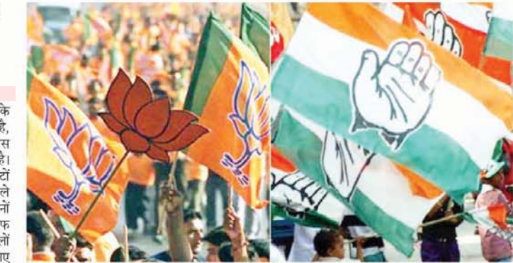
बनाकर घेरने की रणनीति तैयार की है। भाजपा इस दौरान खासतौर पर वचन-पत्र में किसान कर्ज माफी कर्मचारियों से किए गए वादों और भ्रष्टाचार जैसे मामलों को जोड़ने की तैयारी कर रही है। इस दौरान कांग्रेस 15 साल बनाम 15

प्रदेश भले ही कोरोना महामारी के बड़े संकट के दौर से गुजर रहा है, लेकिन सूबे में भाजपा और कांग्रेस में सियासी लड़ाई अनवरत जारी है। इसकी वजह है प्रदेश की 24 सीटों पर निकट भविष्य में होने वाले उपचुनाव। इसके चलते ही दोनों दल एक-दूसरे के खिलाफ हमलावर बने हुए हैं। दोनों ही दलों द्वारा जीत दर्ज करने के लिए अपनी-अपनी राजनीतिक जमीन तैयार करने का काम भी तेजी से किया जा रहा है। कांग्रेस ने चुनाव के दौरान जहां अपने पंद्रह माह के कामकाज जैसे मामलों को जोड़ना बनाई है तो वहीं भाजपा ने भी कांग्रेस के वचन-पत्र को मुद्दा