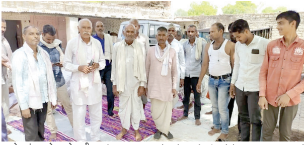
हसदेव जंगल को बचाने राष्ट्रीय आंदोलन पर प्रधानमंत्री के नाम दिया ज्ञापन

केरलासू देश भर से छत्तीसगढ़ के प्रसिद्ध हसदेव अरण्य को नीलामी नहीं किए जाने, बचाने की मांग को लेकर किसानों ने एकदुष्ट होमा शुरू किया है। इसी क्रम में हसदेव जंगल व पर्यावरण, आदिवासीयों की आजीविका, संस्कृति और संविधान को बचाने के लिए राष्ट्रीय आंदोलन पर प्रधानमंत्री के नाम ज्ञापन दिया। ज्ञापन के माध्यम से किसान सभा ने कहा कि हसदेव अरण्य (छत्तीसगढ़) की नीलामी नहीं की जाये। किसान, केंद्र सरकार व छत्तीसगढ़ सरकार से मांग कर रहे हैं कि छत्तीसगढ़ के