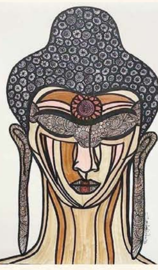
The bid starts at ₹ 20,000/-