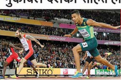
मोनाको ■ एजेसी

विश्व एथलेटिक्स के प्रमुख सेबेस्टियन को ने कहा है कि विश्व एथलेटिक्स मुकाबले 14 अगस्त से मोनाको में फिर शुरू होंगे। सेबेस्टियन ने कहा कि वे दर्शकों के बिना खेलों का आयोजन चाहते हैं या उनके बिना। कोरोना वायरस संक्रमण के खतरों को देखते हुए अभी खेलों का आयोजन खाली स्टेडियमों में ही आयोजन करने की सलाह दी गयी है। विश्व एथलेटिक्स ने 14 अगस्त से मोनाको में सत्र फिर शुरू होने की घोषणा की है।