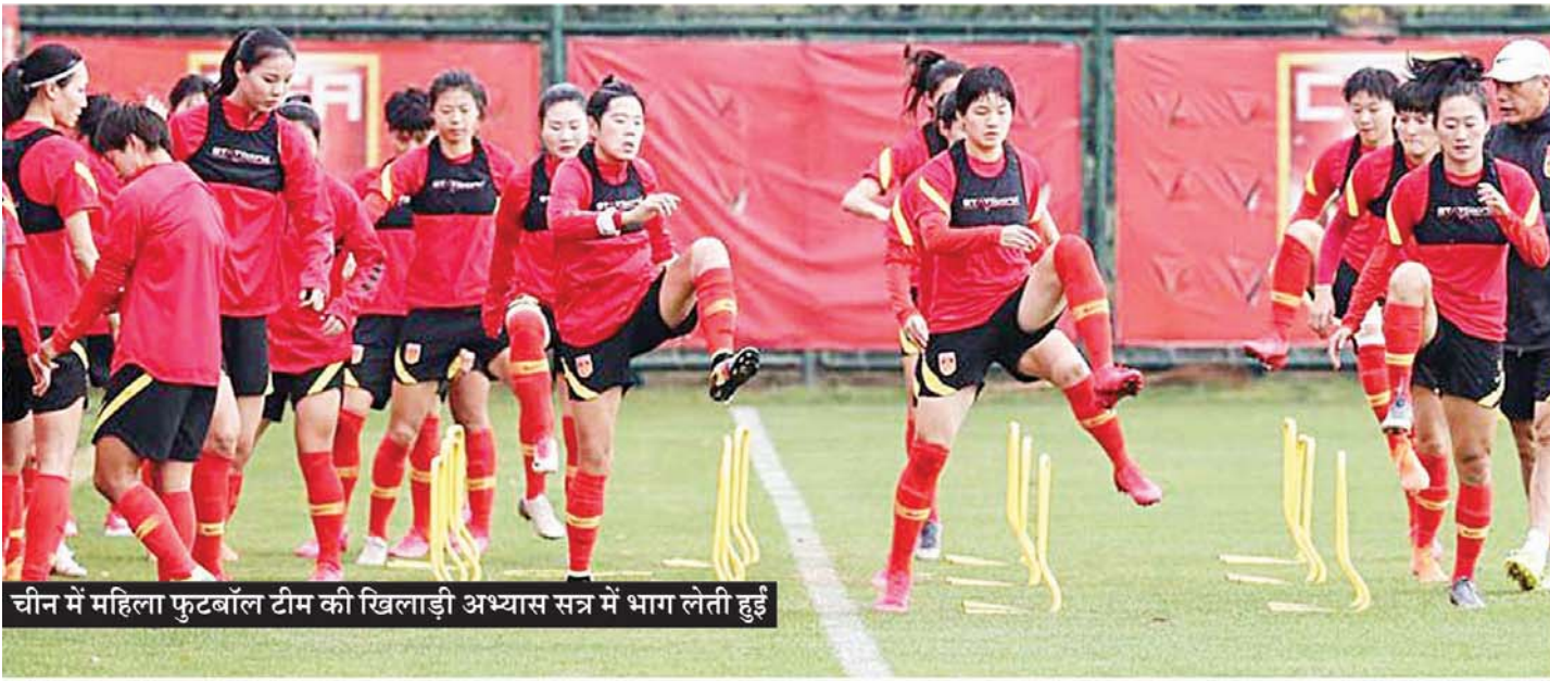
चीन में महिला फुटबॉल टीम की खिलाड़ी अभ्यास सत्र में भाग लेती हुईं