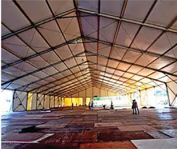
पुलिस पर हमला, 250 बसों को बनाया जाएगा एम्बुलेंस

मुंबई ■ एजेन्सी 24 घंटे में 1,576 नए मामले सामने आए। अब संक्रमितों की कुल संख्या 29,100 हो गई। 24 घंटे में 49 की मौत हुई। अब मृतकों की कुल संख्या 1,068 हो गई है। 49 में से 36 की मौत मुंबई में हुई। 1,576 नए मामलों में से 933 मुंबई के हैं। यहाँ कुल 17 हजार 512 मामले हो गए हैं। राज्य में अब तक 2 लाख 50 हजार 436 लोगों की जांच की जा चुकी है। महाराष्ट्र में रिकवरी रेट 22 प्रतिशत पहुंच चुका है। मुंबई में यह 25 फीसदी है। मुंबई में हर चौथा मरीज ठीक हो रहा है। राज्य में 14 मई तक 27,524 केस सामने आए। इलाज के बाद इनमें से 6,059 मरीज ठीक होकर घर गए। मुंबई से सटे उपनगरों में मीरा-भाईंदर का रिकवरी रेट सबसे बेहतर 60 फीसदी है। उल्हासनगर में 81 में से सिर्फ 11 मरीज ठीक हुए।