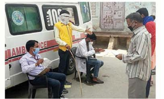
घर वापसी का इंतजार और बढ़ेगा, स्पेशल ट्रेनों में निर्धारित से दस गुना तक अधिक वेटिंग

जयपुर। राजस्थान में कोरोनावायरस के मामले लगातार बढ़ते जा रहे हैं। शनिवार को 177 नए पॉजिटिव केस सामने आए। इनमें सबसे चौकाने वाले आंकड़ा जयपुर जिला जेल से सामने आया। जहाँ 116 कैदी संक्रमित पाए गए। जिसके साथ जयपुर में कुल 122 नए संक्रमित मिले। साथ ही डूंगरपुर में 21, उदयपुर में 9, जोधपुर और भीलवाड़ा में 6-6, अजमेर में 4, सिराहा में 2, चित्तौड़गढ़, बाड़मेर, पाली, सोकर, कोटा, झुंझुनू और भरतपुर में 1-1 संक्रमित मिले। जिसके बाद संक्रमितों का कुल आंकड़ा 4924 पर पहुंच गया। इनमें कुल 2785 लोग रिकवर भी हो चुके हैं। जिसमें से 2480 को डिस्चार्ज किया जा चुका है। अब राज्य में सिर्फ 2014 एक्टिव केस ही बचे हैं। इससे पहले शुक्रवार को 213 नए पॉजिटिव केस सामने आए। इनमें कोटा में 48, उदयपुर में 38, जयपुर में 23, पाली में 13, चित्तौड़गढ़ में 9, सोकर में 7, जैसलमेर में 6, अजमेर में 5, जालौर में 5, दोसा में 4, राजसमंद में 3, नागौर, हनुमानगढ़ और चुरू में 2-2, झालावाड़, बीकानेर, बाड़मेर, झुंझुनू, करीली, डूंगरपुर, बारा, भरतपुर में 1-1 संक्रमित मिले। साथ ही वीएसएफ के 6 जवान भी संक्रमित मिले।