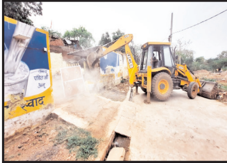
मुक्त कराई गई शासकीय भूमि का बाजार मूल्य लगभग 75 लाख रूप्य है।

तहत शासकीय भूमि पर अतिक्रमण करने वालों के विरुद्ध जिला प्रशासन एवं पुलिस प्रशासन के संयुक्त कार्रवाई। दो स्थानों से लगभग 12500 वर्गफुट शासकीय भूमि को मुक्त कराया गया। जिसका बाजार मूल्य