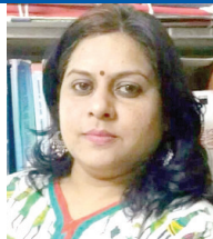
भगवती चरण वोहरा