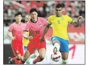
पृष्ठ 8 ■ मूल्य : 2 रु.