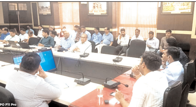
बैठक लेकर दिए गए आवश्यक दिशा-निर्देश

गवालियर। नगरीय निकाय एवं त्रि-स्तरीय पंचायत आम निर्वाचन में अधिकारियों को मददाताओं को भगीरदरी के लिए व्यापक रूप से मददाता जागरूकता अभियान चलाया जायेगा। इस दिशा-निर्देश