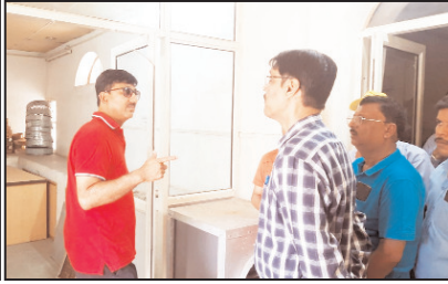
शोध प्रारंभ करें निगम की प्रयोगशाला साथ ही उन्होंने फूलबाग से किला गेट तक किए जा रहे सड़क निर्माण के कार्य को पैदल चक्कर निरीक्षण किया। निरीक्षण के दौरान संबंधित अधिकारियों को निर्देशित किया कि सड़क बनते समय उसकी गुणवत्ता का पूरा ध्यान रखा जाए। इसके साथ ही फूलबाग स्थित नगर निगम की प्रयोगशाला को पुनः दो दिन में शुरू करने के निर्देश दिए और कहा कि प्रयोगशाला के शुरू होने से सड़क निर्माण कार्यों को सभी जांच यही हो सकेगी।