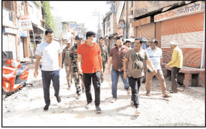
गवालियर। शहर की साफ सफाई व्यवस्था बेहतर बनाने एवं निरंतर मॉनिटरिंग के लिए निगम के वरिष्ठ अधिकारियों द्वारा निरंतर मॉनिटरिंग की जा रही है तथा विभिन्न चाबी का भ्रमण कर कर्मचारियों के साथ आमजन को भी स्वच्छता के प्रति जागरूक किया जा रहा है। इसी के तहत आज सोमवार को निगमायुक्त श्री किशोर कन्याल ने न्यू रेशन मिल् क्षेत्र का निरीक्षण किया। निरीक्षण के दौरान आमजन द्वारा सड़क पर पानी फैलाने के सड़क को धोई जा रही थी। जिस पर निगमायुक्त श्री कन्याल ने पानी का महत्व समझाते हुए पानी न फैलाने की आमजन से अपील की। इसके साथ ही साफ सफाई के नोटें पढ़ीं।