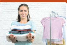
सैल आनी बंद हो जाएगी।

गर्म कपड़ों को धूप दिखाना पुराने जमाने से ही बेहद कारगर उपाय माना गया है। इसके लिए आप कपड़ों को अलमारी या सेंद्रक से निकालकर 3-4 दिनों तक रोजाना 2-3 घंटे धूप लगवा दें। इससे आपको ऊनी कपड़ों से