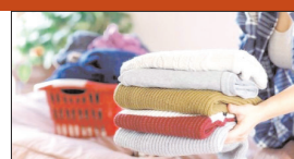
कपड़ों को धोने के बाद नींबू मिश्रित पानी में 15 मिनट तक भिगोएं। इसके बाद कपड़ों को धूप में सुखाएं। इससे गर्म कपड़ों से दुर्गन्ध दूर होकर धीमी-धीमी खुशबू आएगी।

शिमल को सेंद्रक से निकालने के बाद इन्हें एरोसियल ऑयल में धोएं। इसके लिए पानी में कुछ बूंदें एरोसियल ऑयल की डालें। अब कपड़ों को साबुन या सर्फ से धोने के बाद उस पानी में 5 मिनट तक भिगोएं। बाद में ताजे पानी से धोकर धूप में सुखाएं। इससे कपड़ों से दुर्गन्ध आनी बंद हो जाएगी। इसके लिए आप रोजमर्रा, लेवेंडर, लेमनग्रास एरोसियल आदि ऑयल इस्तेमाल कर सकती हैं।