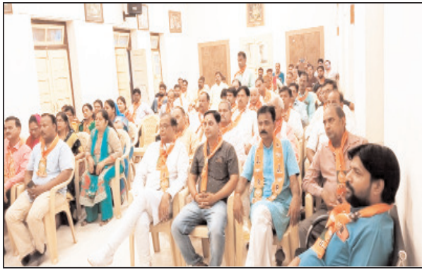
मतदान केन्द्र पर पार्षद प्रत्याशी, महापौर प्रत्याशी अधिकतम मतों से विजयी हो गए हैं। इस हेतु मंडल के पदाधिकारी, मंचों के पदाधिकारी, स्थानीय समिति के अध्यक्ष, वार्ड संयोजक जनता के बीच में जाएं और सरकार की योजनाओं का लाभ निजान भिला है उनसे संबद्ध करें और वताएँ भाषणा विश्व का सबसे बड़ा राजनीतिक दल है। भाजपा के कार्यकर्ता राजनीतिक दल में सेवा करने के लिए समाज में कार्य कर रहे हैं। यही कारण है कि कोरोना काल के दौरान जब अन्य दलों का कार्यकर्ता अपने घरों में बैठ गए थे जब भाजपा के कार्यकर्ताओं ने अपने जान की परवाह किए बिना अपने आकर समाज में काम किया था।