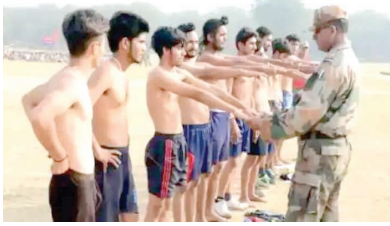
समाज का सैन्यीकरण होगा। यह नीति हमारी संरभूता को रक्षा करने वाले सुरक्षा बलों के मनोबल और व्यावसायिकता को भी काफी प्रभावित करेगी। सशस्त्र बलों में हर साल लाखों युवाओं के लिए सुशिक्षित और दीर्घकालिक रोजगार के स्रोत भी प्रदान किए हैं। यह नीति इस

केलारस। एसएफआई ने केन्द्र सरकार द्वारा हाल ही में घोषित की गई सैन्य भर्ती योजना अग्निपथ को एक आपदा माना है व भारत की संरभूता के लिए खतरा बताया है। केन्द्र सरकार ने पिछले दो वर्षों से नियमित सैन्य भर्ती नहीं करवाई है। जिसके चलते 2021 तक भारतीय सेना में 104,653 कर्मियों की कमी थी। इन पदों को भरने की बजाय केन्द्र सरकार ने अब क्षेत्रीय कोटा को पूरी तरह से खत्म करने का फैसला किया है और 6 महीने को प्रशिक्षण अवधि सहित चार साल की अल्प-अवधि की भर्ती योजना के साथ जाने का फैसला किया है। चार साल बाद लगभग तीन-चौथाई सैनिक विदा पत्र या ग्रेजुएट के सेवानिवृत्त हो जाएंगे। इस नीति के परिणामस्वरूप हर साल अन्य काम की तलाश में लगभग 35,000 बेरोजगार और शामिल होंगे, जिससे समय के साथ