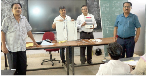
मतदान दल ईवीएम की बारीकियों को समझे