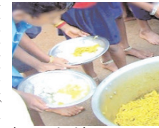
के आला अधिकांशों तक यह मामला पहुंच चुका है। गड़बड़ी की कई शिकायतें भी हैं। ऐसे में गड़बड़ी करने वाले समूहों को एक और मौका

भोपाल। प्रदेश के शहरी क्षेत्रों में पूरक पोषण आहार वितरण व्यवस्था में गड़बड़ी के मामले लगातार सामने आ रहे हैं। ऐसे में उन्हीं स्व-सहायता समूहों को फिर से ठेका देने की तैयारी है, जिन्हें खिलाफ शिकायतें हुई हैं या जो गड़बड़ी में लिप्त पाए गए हैं। कलेक्टर ऐसे मामलों की सुनवाई करेंगे और ठेका देने का फैसला ले सकेंगे। महिला एवं बाल विकास विभाग ने कलेक्टरों को यह स्वतंत्रता देते हुए निर्देश जारी कर दिए हैं। यह व्यवस्था चुनावों से लागू की जा रही है। ग्रामीण क्षेत्रों के आंगनवाड़ी केंद्रों के लिए आजीविका मिशन के तहत संचालित स्व-सहायता समूह पोषण आहार तैयार कर रहे हैं। यही व्यवस्था शहरी क्षेत्र में लागू की जाये तब शहरी में अब भी ठेकेदार ही व्यवस्था सभाले हुए हैं, विभाग