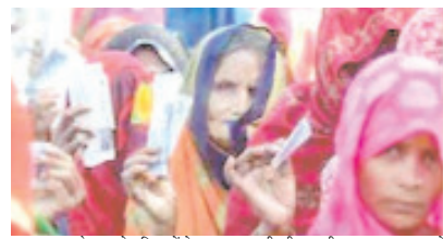
साल 2005 के बाद से महिलाओं ने पुरुष मतदाताओं की तरह ही वोटिंग में बढ़-चढ़कर हिस्सा लिया है। साल 2014-15 के चुनाव में महिला मतदाताओं ने वोट प्रतिशत के मामले में पुरुष मतदाताओं की

भोपाल। प्रदेश में हो रहे सभी तरह के चुनावों में महिलाएं बढ़ती भूमिका निभा रही हैं। ये जीत में बड़ा फैक्टर साबित हो रही हैं। उनका वोट प्रतिशत लगातार बढ़ रहा है। इस बार भी प्रदेश में हो रहे पंचायत चुनावों में महिलाएं जीत में अहम भूमिका निभाएंगी। इसलिए सभी दलों और उनके प्रत्याशियों को महिला वोटर्स पर खास नजर है। बीजेपी जहां महिलाओं को जीत का प्रतीक बता रही है, तो वहीं कांग्रेस का कहना है कि महिलाएं ही लोकतंत्र को जिंदा रखे हुए हैं। वोटिंग के लिए महिलाएं केवल शहरों में ही नहीं, बल्कि गांवों में भी घुरते से बाहर निकल रही हैं। जनकौरों के मुताबिक, मध्य प्रदेश में साल 2005 के बाद से मतदान में महिलाओं का प्रतिशत लगातार बढ़ रहा है।