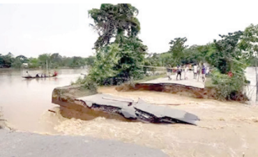
राज्य के 32 जिलों में 4,291 गांवों में 30 लाख से अधिक प्रभावित हुए हैं।

दिसपुर। असम में बाढ़ से हाहाकार मंचा हुआ है। असम राज्य आपदा प्रबंधन प्राधिकरण (एएसडीएफ) ने एक बयान जारी कर जानकारी दी है कि पिछले 24 घंटों में बाढ़ और भूस्खलन से 8 और लोगों की मौत हो गई है। इस मिलाकर अब तक राज्य में मरने वालों की कुल संख्या 62 हो गई है। आठ में से 2 लोग करीमगंज जिले में और 1 व्यक्ति शिलाचर जिले में भूस्खलन की वजह से निधन देव गया और मोकै पर ही मौत हो गई। वहीं बाढ़ के पानी में डूबने से छह लोगों की जान चली गई।