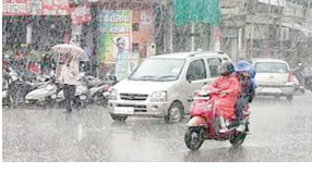
मंगलवार को छिप्टेपूट स्थानों पर भारी बारिश होने की संभावना है। मौसम विभाग ने उप-हिमालयी पश्चिम बंगाल

प्रदेश में भी पहुंच गया। एक-दो को छोड़कर बिहार के सभी जिलों में बारिश शुरू हो गई है। आसमान में बादल छाए हुए हैं। हालांकि पटना में आज दोपहर में धूप छिली हुई है। मौसम विभाग ने अलर्ट किया है कि आगले पांच दिनों के दौरान पश्चिमी हवा पर भारी बारिश हो सकती है। इसके अलावा, मौसम विभाग का अनुमान है कि आगले दो दिनों के दौरान उत्तर, मध्य और पूर्वी भारत में अलग-अलग जगहों पर भारी वर्षा और गरज के साथ छिटे पड़ सकती