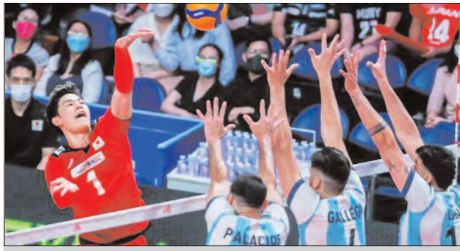
जापान में एकआईवीबी वालीबाल नेसांस लीग में खेलते हुए खिलाड़ी।