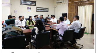
अनिल कुशवाहा ब्युरो पुष्पांजलि टुडे शिवपुरी-संभागायुक्त आशु श्री आशीष सक्सेना बुधवार को शिवपुरी प्रभण पर आए और यहां स्थानीय निर्वाचन की तैयारियों का जांचा लिया। कलेक्ट्रेट सभाकक्ष में कलेक्टर पुलिस अधीक्षक सहित नोडल अधिकारियों के साथ बैठक की। उन्होंने निर्देश देते हुए कहा कि प्रथम चरण में शिवपुरी जिले में 164 ग्राम पंचायतों में निर्वाचन होगा है जिसमें बदरवास और खलियावावा ब्लॉक में प्रथम चरण में चुनाव होंगे। निर्वाचन की तैयारियां लगातार की जा रही है। मतदान केंद्रों पर सभी व्यवस्थाएं सुचारुस्थिति रहे। इसका विशेष ध्यान रखा जाए। हमें स्वतंत्र एवं निष्पक्ष चुनाव संपन्न कराना है। उन्होंने नोडल अधिकारियों से उनके द्वारा किए जा रहे कार्य की भी जांचकारी ली। संभागायुक्त ने निर्देश देते हुए कहा कि महिला एवं बाल विकास विभाग द्वारा मतदान केंद्र पर झूला पर तैयार किए जाएं। इसके अलावा व्यवस्था के लिए आंगनवाड़ी कार्यकर्ता, सहायिका और आशा कार्यकर्ता की भी सख्ती सुनिश्चित की जाए। मतदान केंद्रों पर भीड़ भाड़ ना हो और व्यवस्था पर निगरानी के लिए वालेटियर के रूप में एनएसएस और एनएससी के बच्चों को भी जोड़ा जा सकता है। यह बच्चे अपनी स्पेन्ड से मतदान केंद्र पर वालेटियर के रूप में काम कर सकेंगे। साथ ही उन्होंने कहा कि कारा रहित मतदान के लिए टोकन पची बाटी जाएगी,जिसे बाटी आने पर मतदाता अपना मतदान कर सकेंगे। उन्होंने कहा कि मतदान दलों को सामग्री वितरण व्यवस्था भी व्यवस्थित तरीके से हो और मतदान दल समय पर मतदान केंद्रों पर पहुंचें। उन्होंने कम्युनिकेशन दलों के संबंध में कहा कि सभी टीमें में साथ समन्वय होना चाहिए। पुलिस और प्रशासन द्वारा एक कटरोल रूम स्थापित किया जाए जिससे आपसी समन्वय से बेहतर निगरानी हो सकेगी और यदि कहीं कोई आवश्यकता है और व्यवस्थाओं में सुधार करना है तो तत्काल टीम को भेजा जा सकेगा। अभी परसत का समय है इसलिए मतदान केंद्रों पर पानी ना आर इसके लिए विकल्प के रूप में व्यवस्था अभी सुनिश्चित कर ली जाए।