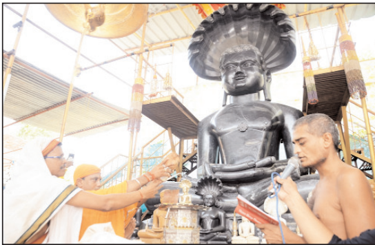
मुनिश्री के चरणों श्रीफल भेंटकर मंगल आशीर्वाद लिया। मुनिश्री ने भगवान जीनेंद्र का अभिषेक व शांतिधारण कराई।