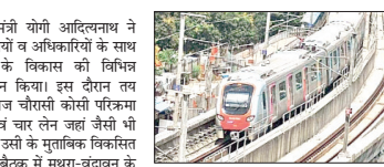
मथुरा-वृन्दावन में चलेगी लाइट मेट्रो सीएम योगी की बैठक में योजना के लिए 10 अरब रुपये को मंजूरी दी गई है।

नई दिल्ली। मथुरा-वृन्दावन में चलेगी लाइट मेट्रो सीएम योगी की बैठक में योजना के लिए 10 अरब रुपये को मंजूरी दी गई है। मथुरा-वृन्दावन में चलेगी लाइट मेट्रो सीएम योगी की बैठक में योजना के लिए 10 अरब रुपये को मंजूरी दी गई है।