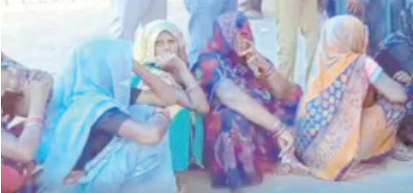
प्रथम चरण में सिक्की जिले पर्यटन और बरखा जिले के वोटिंग में मतदान किया जा रहा है। वोटिंग में भी पंचायत चुनाव के प्रथम चरण का मतदान जारी है।