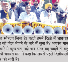
केजरीवाल ने राजनीतिक सरगमियों तेज हो गईं हैं।

कुछ के रोड शो में बीजेपी व कांग्रेस पर बरसे केजरीवाल। हिमाचल प्रदेश में विधानसभा चुनाव का समय नजदीक आते ही राजनीतिक सरगमियों तेज हो गईं हैं।