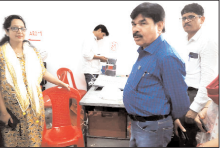
गवालियर। राज्य निर्वाचन आयोग द्वारा निर्धारित कार्यक्रम के तहत जिले में जारी कमीशनिंग के निष्पन्न करने के लिये सभी तैयारियों को नगरीय निकायों के निष्पन्न करने के लिये सभी तैयारियों को जारी रखा है। इस कमी में