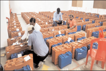
गवालियर नगर पालिक निगम के मतदान केंद्रों पर उपयुक्त में लाल जाले वाली ईवीएम (इलेक्ट्रॉनिक वोटिंग मशीन) की कमीशनिंग का कार्य जारी है। कमीशनिंग का कार्य

यहाँ शासकीय विज्ञान महाविद्यालय परिसर में विभिन्न प्रत्याशियों के प्रतिनिधियों को जूजरी में पुरी पारदर्शिता और आयोग के दिशा-निर्देशों का पालन करते हुए किया जा रहा है।