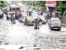
गद्दी नदियों का जलस्तर चेतानवी स्तर से थोड़ा नीचे है। सीएम शिंदे ने अधिकारियों को चिपचुन की स्थिति पर कड़ी नजर रखने और बार-बार निदेश देकर नागरिकों को चेतावनी देने का भी निर्देश दिया। इस बीच मंगलवार दोपहर भारी बारिश के कारण ठाणे, भिवानडी, कल्याण-नासिक राजमार्ग को जोड़ने वाले महत्वपूर्ण लिंक में से एक, भिवंडी के मन्वली नदी का पर एक बड़ा ट्रेफिक जाम लग गया। एक वाहन चलने ने कहा कि ट्रेफिक जाम फलांडाओवर के साथ-साथ नीचे की सड़क पर भी है और वाहन बहुत धीमी गति से आगे बढ़ रहे हैं। मैं काम के लिए ठाणे पहुंचने के लिए लगभग 11.30 बजे कल्याण से निकला। मुगर दोपहर 1 बजे के आसपास भी मैं ट्रेफिक जाम के कारण नाके पर फंस गया था। ठाणे यातायात पुलिस के उपग्रहक दता कावले ने कहा कि भारी बारिश के कारण इस स्ट्रेच पर यातायात प्रभावित होता है। वाहन चल रहे हैं लेकिन थिर-थिर। हमारी टीम यातायात की स्थिति को देखने के लिए सड़क पर तैनात है। पिछले 24 घंटों में, कल्याण, डोंबिवली शहरों में 114 ममी बारिश हुई, जिससे कई हिस्सों में जलपराव हो गया और ट्रेफिक जाम हो गया। कल्याण (पूर्व) पल्लव गड क्षेत्र और कल्याण (पश्चिम) के आडवेली डेवेली और डोंबिवली में नदीवाली इलाके में भारीसा पानी सोमवार से करीब 400 घंटों में घुस गया है।