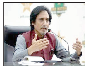
पृष्ठ 8 ■ मूल्य : 2 रु.