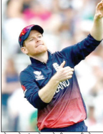
जो उसने लंच से पहले ही अगमानी से बना लिए। दूसरी पारी में रूट ने नाबाद 142 जबकि जॉनी बेयरस्टो ने 114 रन बनाये। * रन बनाये। इस प्रकार भारतीय टीम के हाथों से 15 साल बाद इंग्लैंड के खिलाफ टेस्ट सीरीज जीतने का अवसर निकल गया। इस मैच में नियमित कप्तान रोहित शर्मा और उपकप्तान लोकेश राहुल टीम में नहीं थे। इससे पहले साल 2007 में महतुल द्रविड की

एजबेस्टन। अनुभवी बल्लेबाज जो रूट और जॉनी बेयरस्टो की शतकीय पारियों से मेजबान टीम इंग्लैंड ने यहाँ एजबेस्टन में खेले गये पांचवें क्रिकेट टेस्ट मैच में टीम इंडिया को सात विकेट से हरा दिया। इसी के साथ ही भारतीय टीम का टेस्ट सीरीज जीतने का सपना टूट गया। कोरोना संक्रमण के कारण पिछले साल पूरी नहीं हो पायी यह सीरीज पांचवें टेस्ट में भारत की हार के साथ ही 2-2 से ड्रॉ रही। इस सीरीज में ऑलराउंडर बेन स्टोक्स मेजबान टीम की कप्तानी कर रहे थे जबकि भारतीय टीम की कप्तान तेज गेंदबाज जसप्रीत बुमराह टीम ने दूसरी पारी में जीत के लिए मिले 378 रनों के लक्ष्य को केवल तीन विकेट के नुकसान पर ही हासिल कर लिया। मेजबान टीम ने चौथे दिन का खेल समाप्त करने के समय तक तीन विकेट पर 259 रन बनाये थे। इस प्रकार उसे आंतिम दिन जीत के लिए 119 रनों की जरूरत थी। इससे पहले साल 2007 में महतुल द्रविड की