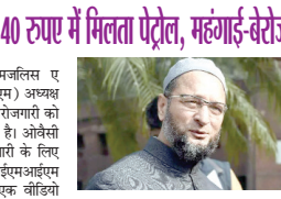
बादशाह अकबर जिम्मेदार है। पेट्रोल 104 रुपए के है इसका जिम्मेदार राजमहल बनने वाला है। अगर तामगल नहीं बना होता तो पेट्रोल आज 40 रुपए में मिलता। मैं मारता हूँ कि तामगल, लालकिला बनकर मुगलों ने कड़ी पकड़ ली है, वह पैसा बचकन रखा जा चुका है। ओवैसी ने सवाल किया कि क्या भारत में सिर्फ मुगलों की

नई दिल्ली। ऑल इंडिया मजलिस ए इतेहादुल मुस्लिमीन (एआईएमआईएम) अध्यक्ष असदुद्दीन ओवैसी ने महंगई और बेरोजगारी को लेकर कई सरकार पर हवाला बोला है। ओवैसी ने कहा कि देश में महंगई, बेरोजगारी के लिए मोदी नहीं मुगल जिम्मेदार हैं। एआईएमआईएम के दिग्दर्शक हजल से ओवैसी का एक वीडियो शेयर किया गया है। ओवैसी एक बयान में संबोधित कर रहे हैं। इसमें वह कई सरकार पर लंज करते हुए कहते हैं कि भारत के युवा बेरोजगार हैं। महंगई आरामदायक छू रही है। डीजल 100 रुपए के पर है। यकौनत इसके लिए पीएम मोदी नहीं, औरंगजेब जिम्मेदार हैं। ओवैसी ने आगे कहा कि बच्चों के पास नौकरी नहीं है।