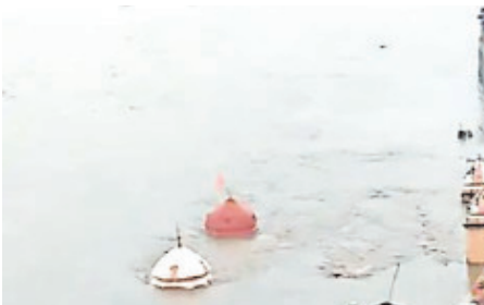
नदी नालों का उफाना ताप है। नदी किनारे बाढ़ का खतरा है।

भोपाल। प्रदेश में बारिश का दौर जारी है। नदी-नाले उफान पर हैं। ताप्ती और चूदा नदी खतरे के निशान से ऊपर हैं। इंदौर में बुधवार रात इमामझम से कई इलाकों में घटनों तक पानी भर गया। शहर के बीच चंद्रभागा इलाके में कारों आघी डूब गईं। पानी घरो में भी घुस गया। चंद्रभागा इलाके में कार बह गई। यहाँ पर 24 घंटे में 2.87 इंच पानी गिरा। हरदा में हालात बेकाबू हैं। मौसम विभाग ने भोपाल सहित 16 जिलों में तेज बारिश का अलर्ट जारी किया है। 24 घंटे में खंडवा में 6.53 इंच, इंदौर में 2.87 इंच, छिंदवाड़ा में 2.04 इंच, भोपाल में 1.57 इंच, उज्जैन में 1.37 इंच पानी गिरा।