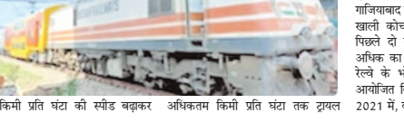
10 किमी प्रति घंटा की स्पीड बढ़ाकर अधिकतम किमी प्रति घंटा तक ट्रायल किया गया। लवान से चोमहला स्टेशनों की बीच अधिकतम गति का ट्रायल सफल रहा। ट्रायल में लोको संख्या 35006 गाजियाबाद का इस्तेमाल किया गया। ट्रायल खाली कोच की स्थिति में किया गया।

जबलपुर। पश्चिम मध्य रेलवे के कोटा मंडल ने फिर से इतिहास रच दिया। कोटा-नागदा सेक्शन पर अत्याधुनिक कोचों का स्पीड ट्रायल सफल रहा। कोटा मंडल के नागदा-कोटा-सवाई माधोपुर सेक्शन में अनुसंधान अभिकल्प मानक संयुक्त की टीम द्वारा 11 जुलाई को अधिकतम गति 180 किलोमीटर/घंटा का ट्रायल किया गया।