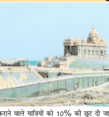
भोपाल। मध्यप्रदेश से दक्षिण भारत की यात्रा पर जाने की इच्छा रखने वाले यात्रियों के लिए अच्छी खबर है। इंडियन रेलवे भारत नीचर यात्रा ट्रेन चलाने जा रहा है। मध्यप्रदेश के भोपाल, ग्वालियर, बीना और इंदौर से बुकिंग की जाएगी। रामेश्वररुम से लेकर कन्वोकुआरी तक AC ट्रेन से यात्रा कराई जाएगी। 9 अगस्त को दिल्ली समुद्रजंम रेलवे स्टेशन से ट्रेन 13 दिनों के साठ इंडिया टूर पर खाना होगी। ट्रेन को 'भारत गौरव' एसी पर्यटक ट्रेन नाम दिया है। इसके लिए भोपाल के साथ ही मधुपुर, आगरा, ग्वालियर, झांसी, बीना, इंदौर से व नागपुर से भी यात्री इसमें सवार हो सकेंगे। इसके लिए प्रित यात्री करीब 54 हजार रुपए लिए जाएंगे। पहली 100 बुकिंग