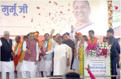
द्रौपदी मुर्मू को भोपाल में स्वागत किया गया।

भोपाल। समर्थन मांगने भोपाल पहुंची एनडीए की राष्ट्रीय पद की प्रत्याशी द्रौपदी मुर्मू ने कहा भारत के हृदय पावन मध्य प्रदेश ने मुझे जिस तरह का स्वागत दिया, ये भयंकर स्वागत मेरी जिन्दगी में पहली बार हुआ है। इसे मैं कभी भी भूल नहीं पाऊंगी। द्रौपदी मुर्मू ने कहा कि मध्य प्रदेश की जनता को भी भयंकर करती हूँ। मैंने मेरे लिए नहीं, इस देश की जनता को गर्व महसूस कराने के लिए राष्ट्रपति पद का प्रत्याशी बनने के लिए हाँ भरि। मुर्मू ने कहा कि मेरे आगे कोई कोई नहीं है। देश की जनता के आर्थिक, सामाजिक और शैक्षणिक विकास के लिए काम करना है। मैं अपने संविधानिक कर्तव्यों में रहकर सेवा करती हूँ। मुझे खुशी है कि आज संगठन के अलावा दूसरे दल भी मुझे समर्थन देने के लिए आगे आ रहे हैं। आगे सभी लोगों का बहुत-बहुत धन्यवाद। मुख्यमंत्री शिवराज सिंह चौहान ने कहा कि आज आनंद और प्रसन्नता का विषय है। द्रौपदी मुर्मू औपचारिक रूप से