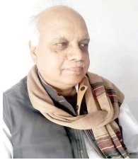
-सर्वोच्च न्यायालय के हस्तक्षेप से ही संभव हुए हैं स्थानीय निकायों के चुनाव: पंचायती राज संस्थाओं और स्थानीय निकायों के चुनावों को लागू 8 वर्ष होने को है। अभी तक सर्वोच्च न्यायालय के बावजूद चुनाव नहीं कराए जा रहे थे। सर्वोच्च न्यायालय के निर्णय के बाद मजबूत पंचायत और नगरी निकायों के चुनाव हुए हैं। सर्वोच्च न्यायालय ने सख्त टिप्पणी करते हुए तत्काल चुनाव कराने का निर्णय पारित किया। जिसके

सरकार का आधा बजट इन संस्थाओं को आवंटित किया गया। जिसे उन्ने दबारा व्यय भी किया गया, जो निरंतर जारी रहा। इसे मॉडल को देश में लागू करना तत्कालीन सरकारों के लिए मजबूरी बन गया। उससे ग्रामीण और नगरीय क्षेत्रों में विकास को नई अवधारणा प्रस्तुत हुई। अब सबे पंचायतों को तैयारी है। पंचायती राज एवं स्थानीय स्वशासन की व्यवस्था को उलटती भाषण की सरकार: जनता को संविधान और लोकतंत्र के जरिए मिले अधिकारों को उलटने के जोरिशों भाषणा सरकारों द्वारा लगातार जारी है। उक्त प्रदेश में हुए पंचायत एवं स्थानीय चुनाव में नन्वता के साथ इसे प्रस्तुत किया गया है। लोग इसे भूल भी नहीं पाए हैं कि, इस बीच मध्यप्रदेश में भी पंचायती राज एवं स्थानीय निकायों के चुनाव में धनबल और बाहुबल के जरिए लोकतंत्र को समाप्त करने की कोशिशों लगातार जारी हैं। वैसे तो स्थानीय निकायों के चुनाव मध्यप्रदेश में सन् 2019 में होने थे। जो नहीं कराए गए। बॉक्स: