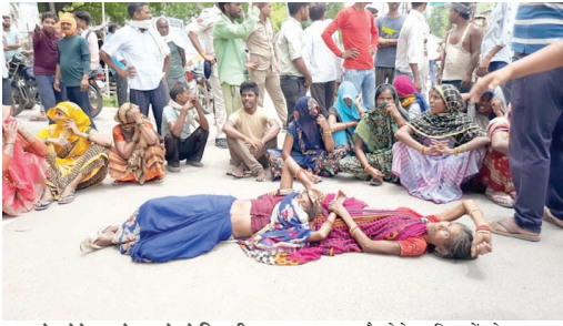
- प्राइवेट टेकेदार के लड़के ने बिजली का बिल कम करने के नाम पर 70 घंटे से रातले 2-2 हजार रुपए

मुरैना। सिविल लाइन थाना क्षेत्र के जौरी गांव सियाराम सरपंच का पुरा गुरुवार को डीपी फुकने से अंधेरा छाया हुआ है और लोग पीने के पानी को भी तरस गए। बिजली ना मिलने से आक्रोशित महिला और पुरुषों ने शुरूआत को दोपहर बिजली घर का घेराव कर चक्का जाम कर दिया, इस दौरान दो महिलाएं बेहोश हो गईं। पुलिस द्वारा चक्कानाम कर रही महिलाओं को