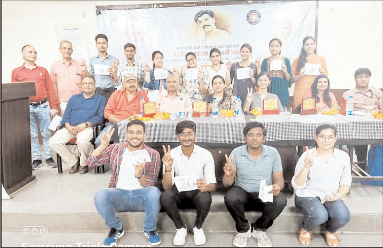
चयनित युवा करेंगे 23-24 जुलाई को भोपाल में सिंहराज

ग्वालियर। भारतीय राष्ट्रीय आंदोलन के जन नायक और महान सैनानी श्री चन्द्रशेखर आजाद जी की 116 वीं जन्मजयंती के अवसर पर प्रदेशस्तर पर आगामी 23 एवं 24 जुलाई को आयोजित किए जाने वाले युवा महापंचायत के लिए जिला स्तर पर युवाओं का चयन आज जिलासंगठक राष्ट्रीय सेवा योजना ग्वालियर की संयुक्त व्यवस्था में माधव महाविद्यालय में किया गया। ज्ञातव्य है कि 16 जुलाई को पूरे प्रदेश में इस हेतु विभिन्न स्क्रीनिंग सेटर्स पर 15 से 29 वर्ष तक के युवा प्रतिभागियों का चयन जिला स्तर के लिए किया गया। ग्वालियर जिले में स्क्रीनिंग के बाद 194 युवा चयनित हुए। युवा महापंचायत के लिए युवाओं का चयन उनकी दक्षता, विषय का ज्ञान, विचारों की स्पष्टता, आचरण, विपक्ष के मतों के प्रति धैर्यता एवं काउंटर पॉइंट रखने की क्षमता को ध्यान में रख कर