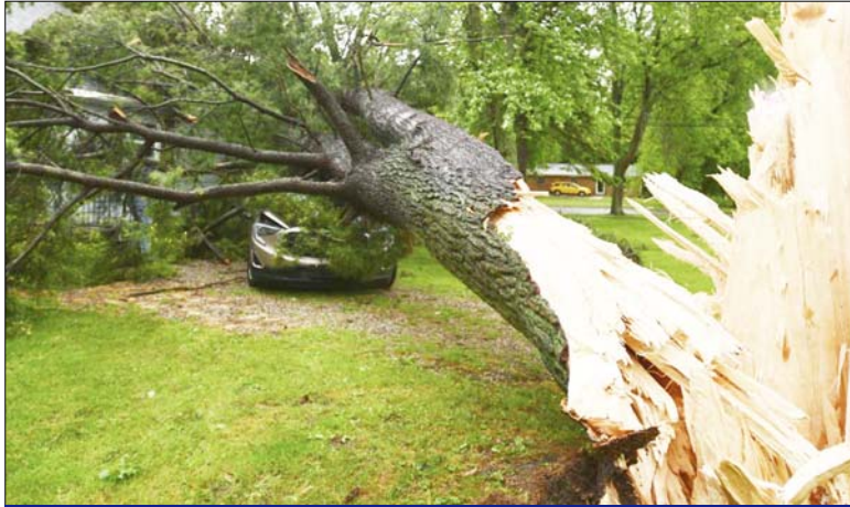
माइकल, कॉनकोर्ड के मेन स्ट्रीट के एक घर में तूफान के कारण पेड़ उखड़ गए। बुधवार को तेज हवाओं के साथ तेज आंधी चली जिसके कारण जैक्सन काउंटी में भारी मात्रा में बिजली के खंभे और पेड़ उखड़ गए।