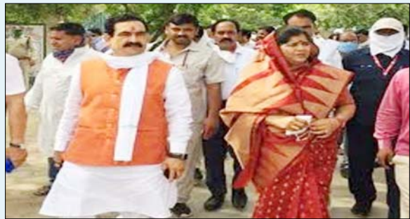
को प्रकाश जावड़ेकर और विनय सहल्युद्धे 18 जून को भाजपा आएंगे। पार्टी ने प्रशिक्षण शिविर में शामिल होने के लिए सभी विधायकों को 17 जून को भाजपा प्रशिक्षण शिविर लगाएंगी। विधायकों को प्रशिक्षण देने के लिए वरिष्ठ नेता प्रकाश जावड़ेकर और विनय सहल्युद्धे 18 जून को भाजपा आएंगे। पार्टी ने प्रशिक्षण शिविर में शामिल होने के लिए सभी विधायकों को 17 जून को भाजपा प्रशिक्षण शिविर लगाएंगी।

भोपाल। गृह एवं स्वास्थ्य मंत्री डॉ. नरोत्तम मिश्रा ने कहा कि डबरा क्षेत्रवासियों को बेहतर स्वास्थ्य सेवाएँ उपलब्ध करवाने के लिये सौ बिस्तरों का अस्पताल बनाया जाएगा। इस अस्पताल के निर्माण पर लगभग साढ़े 6 करोड़ की अनुमानित लागत आवेगी। मंत्री डॉ. मिश्रा ने यह घोषणा रविवार को डबरा सिविल अस्पताल के निरीक्षण के दौरान की। मंत्री डॉ. मिश्रा ने कहा कि डबरा एवं आसपास के क्षेत्र के लोगों को बेहतर चिकित्सा सुविधा उपलब्ध करवाने के लिए एक आधुनिक अस्पताल बनाया जाएगा। इसके लिए डबरा के विभिन्न स्थलों का निरीक्षण किया गया है। निरीक्षण के दौरान निर्णय लिया गया कि डबरा के सिविल अस्पताल परिसर में ही नवीन मल्टी स्टोरी हॉस्पिटल बनाया जायेगा बेहतर रहेगा। डॉ. मिश्रा ने बताया कि शीघ्र ही जिला प्रशासन द्वारा प्रस्ताव प्रेषित किया जाएगा, जिसे शासन स्तर से स्वीकृत करारकर आवश्यक राशि मंजूर की जाएगी। उन्होंने कहा कि टेंडर प्रक्रिया पूर्ण कर जल्द से जल्द अस्पताल का निर्माण का कार्य प्रारंभ किया जाएगा। प्रमग के दौरान पूर्व मंत्री श्रीमती इमरती देवी सहित जनप्रतिनिधि और स्थानीय प्रशासन के वरिष्ठ अधिकारी साथ रहे।