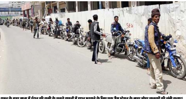
यमन के लहर साना में ईरान की कमी के चलते वहाँनों में इरान मराने के लिए एक गैस स्टेशन के बाहर मोहर बालकों की लंबी कतार।

बातचीत के दौरान ट्रम्प नॉर्थ कैरोलाइना के डेमोक्रेटिक गवर्नर की आलोचना कर चुके हैं। रिपब्लिकन पार्टी की नॉर्थ कैरोलाइना में अगस्त में अपना राष्ट्रीय सम्मेलन आयोजित करना है। उन्होंने कहा कि नॉर्थ कैरोलाइना के गवर्नर कोरोना वायरस संकट के बीच राज्य को खोलने में धीमी गति से चल रहे हैं। ट्रम्प ने कहा कि कई राज्य सम्मेलन की मेजबानी करना चाहते हैं जिनमें प्रमुख टेक्सास, जॉर्जिया और फ्लोरिडा हैं। इसमें आने वाले 100 सालों के लिए फिलहाल 22 ऐसे ऐंस्टरोइड्स हैं जिनके पृथ्वी से