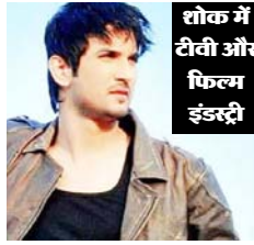
रोक में टीवी और फिल्म इंडस्ट्री