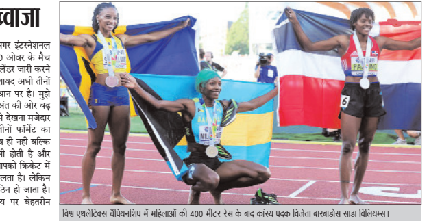
विश्व एथलेटिक्स चैंपियनशिप में महिलाओं की 400 मीटर रैस के बाद कांस्य पदक विजेता बाराबोरसा साहा विलियमस।

क्रिकेट को से कहा कि यह साफ है कि अगर इंटरनेशनल कैलेंडर से कुछ हटाया जाएगा तो बेशक 50 ओवर के मैच होंगे।