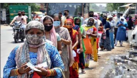
कहा कि जब महामारी पनकर समुदायों के बीच घट बना लेती है, तब वह किसी भी समय अपना प्रकोप दिखा सकती है, जैसा कई स्थानों पर देखा गया। उन्होंने कहा कि भारत में देशव्यापी लाकडाउन जैसे कदमों ने संक्रमण को फैलने की रफ्तार कम रखी है लेकिन देश में गतिविधियाँ शुरू होने के साथ मामले बढ़ने का खतरा बना हुआ है। रिचमन ने कहा कि भारत में उठाए कदमों का निश्चित रूप से संक्रमण फैलने की रफ्तार कम करने की दिशा में असर हुआ और अन्य कई देशों की तरह भारत में भी गतिविधियाँ शुरू होने, लोगों की आवाजाही फिर से आरंभ होने