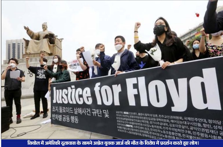
सिसोल में अमेरिकी दूतावास के सामने अश्वेत युवक जार्ज फ्लॉयड की मौत के विरोध में प्रदर्शन करते हुए लोग।