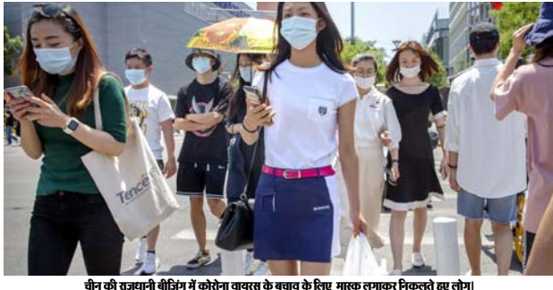
चीन की राजधानी बीजिंग में कोरोना वायरस के संचार के लिए मार्क लगाकर निकलते हुए लोग।

पेरिस। फ्रांस ने कहा है कि माली में नॉर्थ अफ्रीका के अलकायदा चीफ अब्देलमलेक झुकिडेल को मार गिराया गया है। फ्रांस की रक्षा मंत्री फ्लोरेंस पार्लो ने कहा कि माली में इस ऑपरेशन के दौरान इस्लामिक स्टेट ग्रुप के एक सीनियर कमांडर को दबोच लिया गया। यह आतंकवाद के खिलाफ बड़ी सफलता है और एमार्ग सैनिक युद्ध मुस्लिमों की भी आगाह करता था। उसने अफगानिस्तान में भी लड़ाई लड़ी थी।