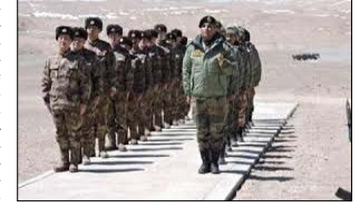
सीमा क्षेत्र के नए हिस्सों में अपना कब्जा करने की कोशिश की। ऐसे में यदि वर्तमान में जारी बातचीत के कोई खास परिणाम नहीं निकलते हैं तो भारत के सामने दो मुश्किल विकल्प ही रहेंगे-या तो अपने नुकसान को कम से कम