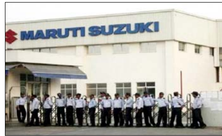
वक्तव्य में कहा गया है कि इस वित्तपोषण सुविधा में 'आकर्षक ब्याज दर' के साथ ही ऐसे ग्राहकों को भी कर्ज उपलब्ध हो जायेगा जिनका आय का कोई समूत नहीं

नई दिल्ली। देश की सबसे बड़ी कार बनाने वाली कंपनी मारुति सुजुकी इंडिया (एमएसआई) ने कहा कि उसने यह सहजों को कार खरीदने के लिये सरल और लचीली वित्तपोषण सुविधा उपलब्ध करने के लिये करूर वैश्य बैंक के साथ भागीदारी की है। मारुति सुजुकी इंडिया ने यहां जारी एक वक्तव्य में कहा है कि बैंक के साथ इस भागीदारी के जरिये वह कंपनी के संभावित खरीदारों को छह महीने के अवकाश के साथ कार खरीदने की पूरी वित्तपोषण सुविधा उपलब्ध करायेंगी। यह सुविधा बैंक ईको को छोड़कर कंपनी के अन्य सभी मॉडल पर उपलब्ध होगी। यह सुविधा वेतनभोगी तबके और खुद का कारोबार करने वाले सभी ग्राहकों को उपलब्ध होगी। ग्राहक को यह रिण 84 माह में चुकाना होगा।