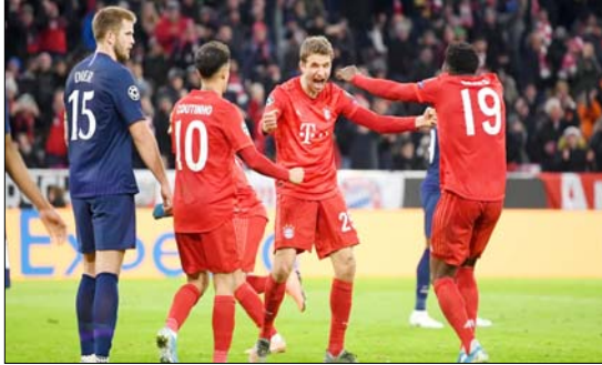
ने पिछले महीने भी बुंदेसलीगा के फिनिश से हुए होने के बाद सात जीत दर्ज की हैं और इस तरह से अपना कुल 30वां खिताब जीता है। गौरतलब है कि कोरोना वायरस महामारी के कारण यह लीग मार्च से ही रुकी हुई थी।

ब्रेमन। राबर्ट लेवानडोवस्की के शानदार गोल से जर्मनी में बायर्न म्यूनिख क्लब ने बंडेसलीगा को 1-0 से हराकर लगातार आठवां बार बुंदेसलीगा लीग फुटबॉल खिताब जीता है। इस जीत से बायर्न में दूसरे स्थान पर कायम बोर्सिया डॉर्टमंड क्लब पर 10 अंक का बढ़ावा बना ली है। डॉर्टमंड अपने बाकी बचे तीन मैचों में अधिक से अधिक नौ अंक ही हासिल कर सकता है। बंडेसलीगा में बायर्न को पहले हाफ में अधिकतर समय रोके रखा, पर बायर्न अंत में गोल करने में सफल रही। लेवानडोवस्की ने यह गोल खेल के 43वें मिनट में किया। जेरोम बोर्टो ने लेवानडोवस्की को तरफ गेट बढ़ाई, जिसे उन्होंने किसी प्रकार रोककर गोल दगा। यह बुंदेसलीगा के इस सत्र में उनका 31वां गोल रहा है। बायर्न के अलफोंसो डेविस को 79वें मिनट में दूसरा पीला कार्ड दिखाया गया, जिसके कारण टीम को 10 खिलाड़ियों के साथ खेलना पड़ा। वहीं गोलकीपर मैनुअल न्यूर ने अंतिम क्षणों में युवा ओसको के हेडर को रोककर बायर्न