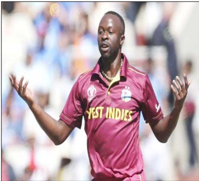
लंदन। वेस्टइंडीज के तेज गेंदबाज केमार रोच ने कहा है कि इंग्लैंड के खिलाफ अगले महीने आठ जुलाई से शुरू हो रही तीन मैचों की टेस्ट सीरीज में उनकी टीम जीत के इरादे से खेलेगी है। इंडीज तेज गेंदबाज रोच ने कहा इस दौरे इंग्लैंड की ओर से खेल रहे कैरेबियाई मूल के तेज गेंदबाज जोफा

आर्चर को कड़ी चेतावनी देते हुए कहा कि इस सीरीज में उसके प्रति कोई नरमी नहीं करते हुए कड़ी टक्कर दी जाएगी। रोच के अनुसार जब दोनों टीमों में मैदान पर एक-दूसरे के आमने-सामने होंगी तो उनका ध्यान केवल जीत पर रहेगा। रोच ने कहा, 'जोफा ने अपना फैसला कर लिया है और मैं समझता हूँ कि उसने अब तक के अपने करियर में शानदार प्रदर्शन किया है पर इस सीरीज में बेहतर क्रिकेट खेलना और जीतना ही हमारा लक्ष्य है। जब हम जोफा के सामने होंगे तो हमारे पास उसका मुकाबला करने के लिए एक शानदार योजना होगी। मैं और मेरी टीम उस पल का इंतजार कर रहे हैं 100 वेस्टइंडीज की 11 रिजर्व खिलाड़ियों सहित कुल 25 सदस्यीय टीम इस दौरे पर पहुंची है और इस समय वह मैनचेस्टर में 14 दिन के अनिवार्य क्वारंटीन पर हैं। वेस्टइंडीज को इंग्लैंड के खिलाफ आठ जुलाई से खाली स्टेडियमों में तीन मैचों की टेस्ट सीरीज खेलनी है। कोरोना महामारी के कारण पिछले तीन महीने से दुनिया भर में क्रिकेट मुकाबले रुके हुए हैं और इस सीरीज से उनकी वापसी होने जा रही है।