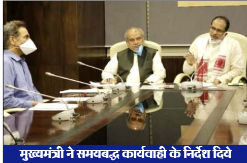
मुख्यमंत्री ने समयबद्ध कार्यवाही के निर्देश दिये

मुख्यमंत्री चौहान ने विद्यार्थियों के हित में लिया बड़ा निर्णय