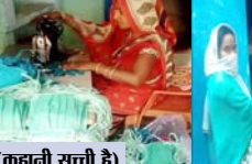
(कहानी सच्ची है)

मुँना। कोरोना संक्रमण जैसी वैश्विक महामारी के कारण मुँना ही नहीं देश, विदेशों में भी इस बीमारी से हाहाकार मचा हुआ है। इस महामारी काल में मुँना जिले के 10 स्व-सहायता समूहों ने 31 हजार 230 मास्क बनाकर लोगों को कोरोना वायरस से बचाने का काम ही नहीं किया, बल्कि समूह की गरीब महिलाओं को रोजगार दिलने का भी कार्य किया है। मुँना जिले में माध्यप्रदेश राज्य ग्रामीण आजीविका मिशन द्वारा पिछले वर्ष ग्राम नुरावदन में 10 स्व-सहायता समूहों का गठन किया गया था। समूह में ऐसी महिलाओं को शामिल किया गया था, जो कुछ हद तक सौकर्य गणना के पर ख उभरने में सहायोग करना चाहती थी।