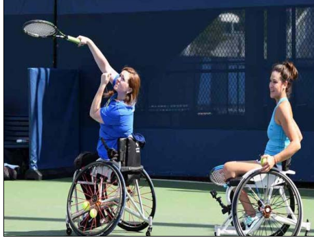
कार्यक्रम जारी करने से पहले उन्हें व्हीलचेयर खिलाड़ियों के साथ मिलना चाहिए था। अमेरिकी ओपन का आयोजन 31 अगस्त से

न्यूयॉर्क । कोरोना वायरस संक्रमण को देखते हुए इस साल अमेरिकी ओपन टेनिस में व्हीलचेयर स्पर्धा को शामिल किया जायेगा। अमेरिकी ओपन के आयोजकों ने कहा है कि वह इस साल का कार्यक्रम जारी करने से पहले व्हीलचेयर खिलाड़ियों से एक बार बात करेगा। आयोजकों ने साथ ही कहा है कि वह इसके बाद अपने फैसले पर एक बार फिर विचार कर सकते हैं। इससे पहले अमेरिकी टेनिस संघ (यूएसटीए) ने व्हीलचेयर टेनिस नेचुरल से बात की और कहा कि अमेरिकी ओपन का