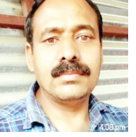
महानगरी, पहरों व गांवों के लोगों को जागरूक किया जाए।

का नुकसान होता जा रहा है। 25 जुलाई को किन्नोर जिला में भूखंडन की चपेट में आने के कारण 9 पर्यटकों को कहर मारने से हिमाचल में तबाही हुई थी।