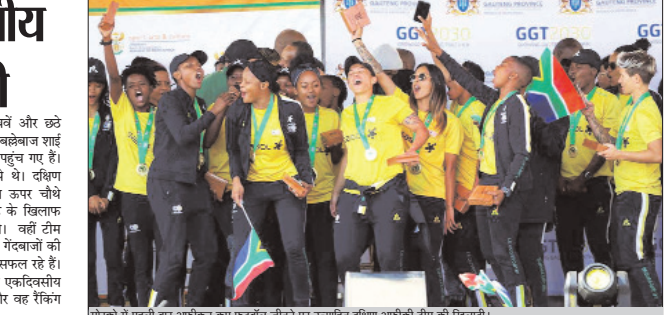
मोस्को में पहली बार अफ्रीकन कप फुटबॉल जीतने पर उत्साहित दक्षिण अफ्रीकी टीम की खिलाड़ी।

शामा एक स्थान नीचे फिसलकर पांचवें और छठे नंबर पर खिसक गए हैं। वेस्टइंडीज के बल्लेबाज शाई होप 3 पायदान ऊपर 12वें स्थान पर पहुंच गए हैं। उन्होंने दूसरे मैच में 115 रन बनाये थे। दक्षिण अफ्रीका के क्रिंटन डिकॉक दो स्थान ऊपर चौथे स्थान पर पहुंच गए हैं। उन्होंने इंग्लैंड के खिलाफ तीसरे मैच में नाबाद 82 रन बनाए थे। वहीं टीम इंडिया के तेज गेंदबाज मोहम्मद सिराज गेंदबाजों की सूची में शीर्ष-100 में जगह बनाने में सफल रहे हैं। सिराज ने वेस्टइंडीज के खिलाफ पहले एकदिवसीय में 57 रन देकर 2 विकेट लिए थे और वह रैंकिंग में अभी 97वें स्थान पर हैं।