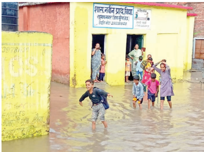
शहर में पानी का निकास ना होने से मुख्य मार्गों पर भी हो रहा जलमग्न

मुरैना शहर में रू तो आए दिन बारिश हो रही है और जलभराव की समस्या नई नहीं है। गुरुवार को दोपहर को 2 घंटे की बारिश के बाद शहर के चारों ओर जलभराव हो गया और आम जनता को परेशानियों का सामना करना पड़ा। सुभाष नगर इलाके में तो सरकारी