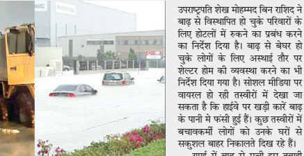
उपराष्ट्रपति शेख मोहम्मद बिन राशिद ने बाढ़ से विस्थापित हो चुके परिवारों की लिए होटलों में रुकने का प्रबंध करने का निर्देश दिया है। बाढ़ से बेघर हो चुके लोगों के लिए अस्थाई तौर पर शेक्टर होम की व्यवस्था करने का भी निर्देश दिया गया है। सोशल मीडिया पर वायरल हो रही तस्वीरों में देखा जा सकता है कि हड़ते पर खड़ी कारों बाढ़ के पानी में फंसी हुई हैं। कुछ तस्वीरों में बचावकारियों को उनके घरों से सकुशल बाहर निकालते दिख रहे हैं।

बाढ़ से विशेष रूप से शारजाह, रास अल खैमाह और फुजैराह जैसे इलाके बुरी तरह प्रभावित हुए हैं। रास अल खैमाह की कई गाड़ियां और बांध प्रभावित हुए हैं। स्ट्रीट सेंटर से दबीटो किराए पर गए वीडियो में कई इलाकों में भारी जलभराव देखा गया है। इसमें से अल ब्याह वादी का वीडियो सबसे भयावह है। शारजाह पुलिस ने स्थानीय