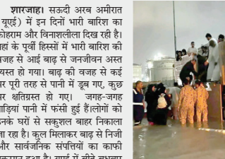
शारजाह। सकुटी अरब अमीरात (यूएई) में इन दिनों भारी बारिश का कोहराम और विनाशालीला दिख रही है। यहां के पूर्वी हिस्सों में भारी बारिश की वजह से आई बाढ़ से जनजीवन अस्त व्यस्त हो गया। बाढ़ की वजह से कई घर पूरी तरह से पानी में डूब गए, कुछ घर क्षतिग्रस्त हो गए। जगह-जगह गाड़ियां पानी में फंसी हुई हैं लोगों को उनके घरों से सकुशल बाहर निकालना जा रहा है। कुल मिलाकर बाढ़ से निजी और सार्वजनिक संस्थानों का काफी नुकसान हुआ है। यूएई में वीते बुधवार से शुरू हुई बारिश गुववार को भी जारी रही। दो दिनों की भारी बारिश के बाद कई पूर्वी इलाकों में बाढ़ से तबाही मची है।

बाढ़ से विशेष रूप से शारजाह, रास अल खैमाह और फुजैराह जैसे इलाके बुरी तरह प्रभावित हुए हैं। रास अल खैमाह की कई गाड़ियां और बांध प्रभावित हुए हैं। स्ट्रीट सेंटर से दबीटो किराए पर गए वीडियो में कई इलाकों में भारी जलभराव देखा गया है। इसमें से अल ब्याह वादी का वीडियो सबसे भयावह है। शारजाह पुलिस ने स्थानीय