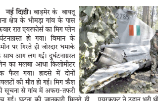
एयरफोर्स ने उड़ान भरती थी। ये उड़ान ट्रेनिंग उड़ान थी। दुर्घटना के कारणों का पता लगाने के लिए कोर्ट ऑफ इंक्वायरी के आदेश दे दिए गए हैं। भारतीय वायुसेना ने अपने दबीटो में कहा, 'भारतीय वायुसेना का दो सीटों वाला मिग-21 ट्रेनर विमान राजस्थान के उत्तरालई हवाई अड्डे से प्रशिक्षण उड़ान के

लिए रवाना हुआ। रात करीब 9:10 बजे बाइमेर के पास विमान दुर्घटनाग्रस्त हो गया। दोनो पायलटों को जानलेवा चोटें लगीं। एक अन्य दबीटो में कहा, 'भारतीय वायुसेना को पायलटों की जान जाने का गहरा दुख है और वह शोक को इस घड़ी में शोक संतप्त परिवारों के साथ मजबूती से खड़ी है। दुर्घटना के कारणों का पता लगाने के लिए कोर्ट ऑफ इंक्वायरी के आदेश दे दिए गए हैं। ग्रामियों को मुताबिक विमान जैसे ही जमीन पर गिरा, उसमें तेज धमक के साथ आग लग गई। विमान जमीन पर गिरा, वहां पर जमीन में 15 फीट गड्ढा हो गया। आग की लपटें दूर तक देखी गईं। रात में अधेरा होने को समझ भाजपा और प्रधामंत्री के लिए उग्र रही है उससे एक नई जागृकता पैदा हो रही है।