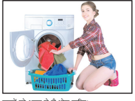
कपड़ों को अलग से धोना चाहिए। कपड़ों को धोने के लिए इकट्ठा करना: आजकल लगभग हर घर में वॉशिंग मशीन मिल जाती है। इस मिशन

लोग नहाने के बाद शरीर को सूखे कपड़े से नहीं धोते, तो कई लोग हप्तों तक गंदे कपड़े इकट्ठा करके रखते हैं। ऐसे में आपको इन छोटी-छोटी आदतों से आपको फंगल इन्फेक्शन, बैक्टीरियल इन्फेक्शन और किन डर्मेटाइटिस जैसी बीमारियां हो सकती हैं। आइए जानते हैं आपको कपड़े धोने और सुखाने में क्या सावधानी बरतनी चाहिए। कोरोना संक्रमित व्यक्ति के कपड़ों को अलग से धोएं - अगर घर में कोई कोरोना या दूसरे वायरस से संक्रमित तो उसका कपड़े अलग से धोएं। इससे वायरस दूसरों के कपड़ों में नहीं फैलेंगा। यदि घर में कोई कोरोना संक्रमित व्यक्ति है तो उसके कपड़ों डिस्टिन्फेक्ट करके ही धोना चाहिए। क्योंकि कोविड मरीज का सूटम आर कपड़ों पर है तो वो वाकी लोगों के कपड़ों पर भी जाएगा, इसलिए कोरोना या ब्रूक फंगस से संक्रमित व्यक्ति के