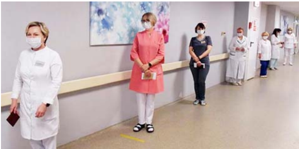
रुम में कानून में संशोधन के लिए वक्तार में लगे हुए विधिविदय कर्मचारी।

निर्देश आरंभ है। नेपाली सरकार के लिए हिंदी भाषा को बैन करना आसान नहीं होगा। वता है कि नेपाली के बाद इस हिमालय देश में सबसे ज्यादा मैथिली, भोजपुरी और हिंदी बोली जाती है। नेपाल के तराई क्षेत्र में रहने वाली ज्यादातर आबादी भारतीय भाषाओं का ही प्रयोग करती है। ऐसी स्थिति में अगर नेपाल में हिंदी को बैन करने के लिए कानून लाया जाता है तो तराई क्षेत्र में सख्खा विरोध