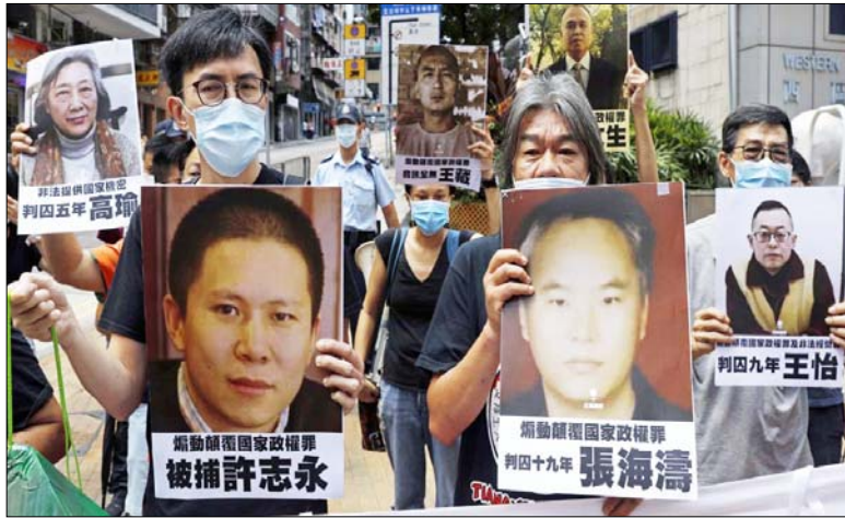
हांगकांग में लोकतंत्र समर्थक प्रदर्शनकारियों ने जेल में बंद चीनी वकीलों और कानूनविदों की तस्वीरें लेकर विरोध जताया।