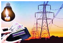
दृष्टिगत विद्युत उपभोक्ताओं को राहत देने के उद्देश्य से महत्वपूर्ण निर्णय लिये गये हैं। प्रदेश के निम्नदाब गैर धरेलू एवं निम्नदाब औद्योगिक उपभोक्ताओं तथा उच्चदाब धरेलू देयकों में स्थायी प्रभार की बसुली को आस्थगित किया गया है। आस्थगित राशि की बसुली माह अक्टूबर 2020 से मार्च 2021 के विद्युत देयकों के निगमित भुगतान के साथ 6 समान किश्तों में बिना व्याज के की जायेगी। प्रदेश के जिन उपभोक्ताओं

भोपाल । प्रदेश के कृषि उपभोक्ताओं को फ्लेट रेट के 10 हार्सपावर तक के पंप पर 700 रूपये प्रति हार्सपावर प्रतिवर्ष की दर से तथा 10 हार्सपावर से अधिक के फ्लेट रेट उपभोक्ताओं को 1400 रूपये प्रति हार्सपावर प्रतिवर्ष की दर से बिजली दी जा रही है। इसके साथ ही एक हेक्टेयर तक कृषि भूमि वाले अनुसूचित जाति/जनजाति उपभोक्ताओं के 5 हार्सपावर तक के कनेक्शन में निशुल्क विद्युत प्रदाय किया जा रहा है। राज्य शासन द्वारा कोरोना महामारी में प्रभावी लॉकडाउन के